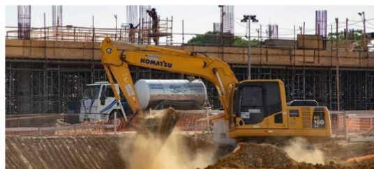
Drenagem e Urbanização (Tucunduba e Murucutu)

Valor: R$ 50 milhões Localização: Av. Dr. Freitas, s/n – Marco Execução: Governo do Estado do Pará