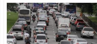
Pavimentação Asfáltica em Belém

Valor: R$ 195 milhões Localização: Avenida Brigadeiro Protásio - Centro Execução: Governo do Estado do Pará