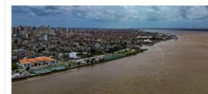
Terminal Hidroviário de Belém

Valor: R$ 126 milhões Localização: Não especificado Execução: Governo do Estado do Pará