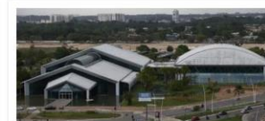
Hangar - Plano de Investimento Multisetorial

Valor: R$ 253 milhões Localização: Rua da Marinha Execução: Governo do Estado do Pará