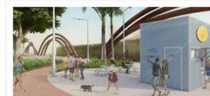
Reurbanização e Macrodrenagem - Parque Tamandaré

Valor: R$ 740 milhões Localização: Canais Murutucu, Mártir e Ana Deusá Execução: Governo do Estado do Pará