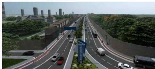
Duplicação da Rua da Marinha (Mangueirão)

Valor: R$ 253 milhões Localização: Rua da Marinha Execução: Governo do Estado do Pará