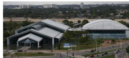
Hangar - Plano de Investimento Multisetorial

Valor: R$ 253 milhões Localização: Rua da Marinha Execução: Governo do Estado do Pará