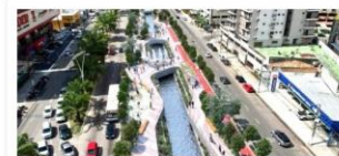
Parque Linear Doca

Valor: R$ 149 milhões Localização: Avenidas da cidade de Belém Execução: Governo do Estado do Pará