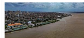
Requalificação Urbana da Feira do Galo

Valor: R$ 192 milhões Localização: Avenida Almirante Tamandaré Execução: Governo do Estado do Pará