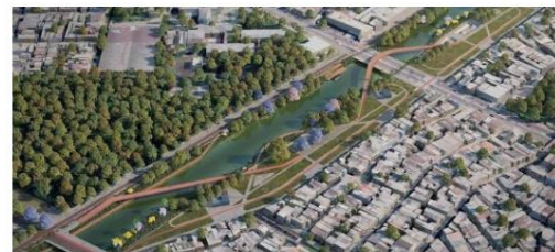
Parque Linear São Joaquim