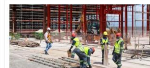
Urbanização e Drenagem - Mangueirão

Valor: R$ 184 milhões Localização: Sacramento Execução: Governo do Estado do Pará