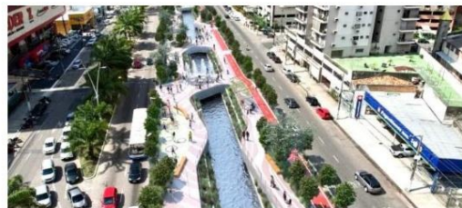
Parque Linear Doca