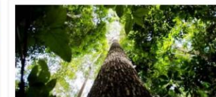
Gestão de Resíduos Sólidos e Bioeconomia

Valor: R$ 89 milhões Localização: Av. José Bonifácio - São Brás Execução: Prefeitura de Belém