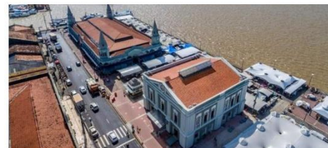
Esgotamento Sanitário - Mercado Ver-o-Peso

Neste espaço, é possível acessar obras que utilizaram recursos do Orçamento-Geral da União em preparação para o evento da COP30, em Belém (PA). Estão publicados os valores, a localização, o órgão responsável pela execução, bem como detalhes referentes ao investimento público.