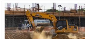
Drenagem e Urbanização (Tucunduba e Murucutu)

Valor: R$ 50 milhões Localização: Av. Dr. Freitas, s/n - Marco Execução: Governo do Estado do Pará