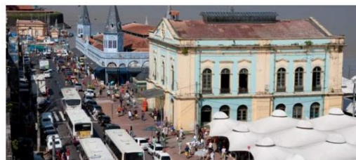
Reforma do Complexo Ver-o-Peso