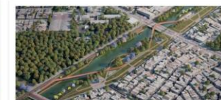
Parque Linear São Joaquim

Valor: R$ 366 milhões Localização: Avenida Visconde de Souza Franco - Reduto Execução: Governo do Estado do Pará