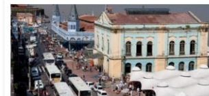
Reforma do Complexo Ver-o-Peso

Valor: R$ 150 milhões Localização: Avenida Júlio César Execução: Prefeitura de Belém