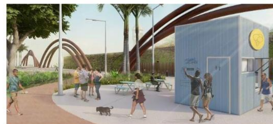
Reurbanização e Macrodrenagem - Parque Tamandaré

Valor: R$ 740 milhões Localização: Canais Murutucu, Mártir e Ana Deusa Execução: Governo do Estado do Pará