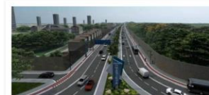
Duplicação da Rua da Marinha (Mangueirão)

Neste espaço, é possível acessar obras do Governo Federal, financiadas pelo Banco Nacional de Desenvolvimento Econômico e Social (BNDES), em preparação para o evento da COP30, em Belém (PA). Estão publicados os valores, a localização, o órgão responsável pela execução, bem como detalhes referentes ao investimento público.