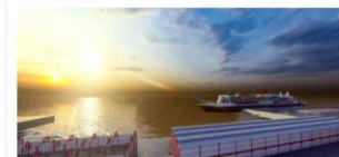
Reforma do Mercado de São Brás

Neste espaço, é possível acessar obras do Governo Federal, financiadas pela Itaipu Binacional , em preparação para o evento da COP30, em Belém (PA). Estão publicados os valores, a localização, o órgão responsável pela execução, bem como detalhes referentes ao investimento público.