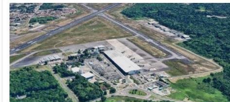
Infraestrutura da Base Aérea de Belém

Valor: R$ 18,5 milhões Localização: Boulevard Castilhos França - Campina Execução: Governo do Estado do Pará Mais Informações: Convênio no Portal e Execução no Transferegov.br