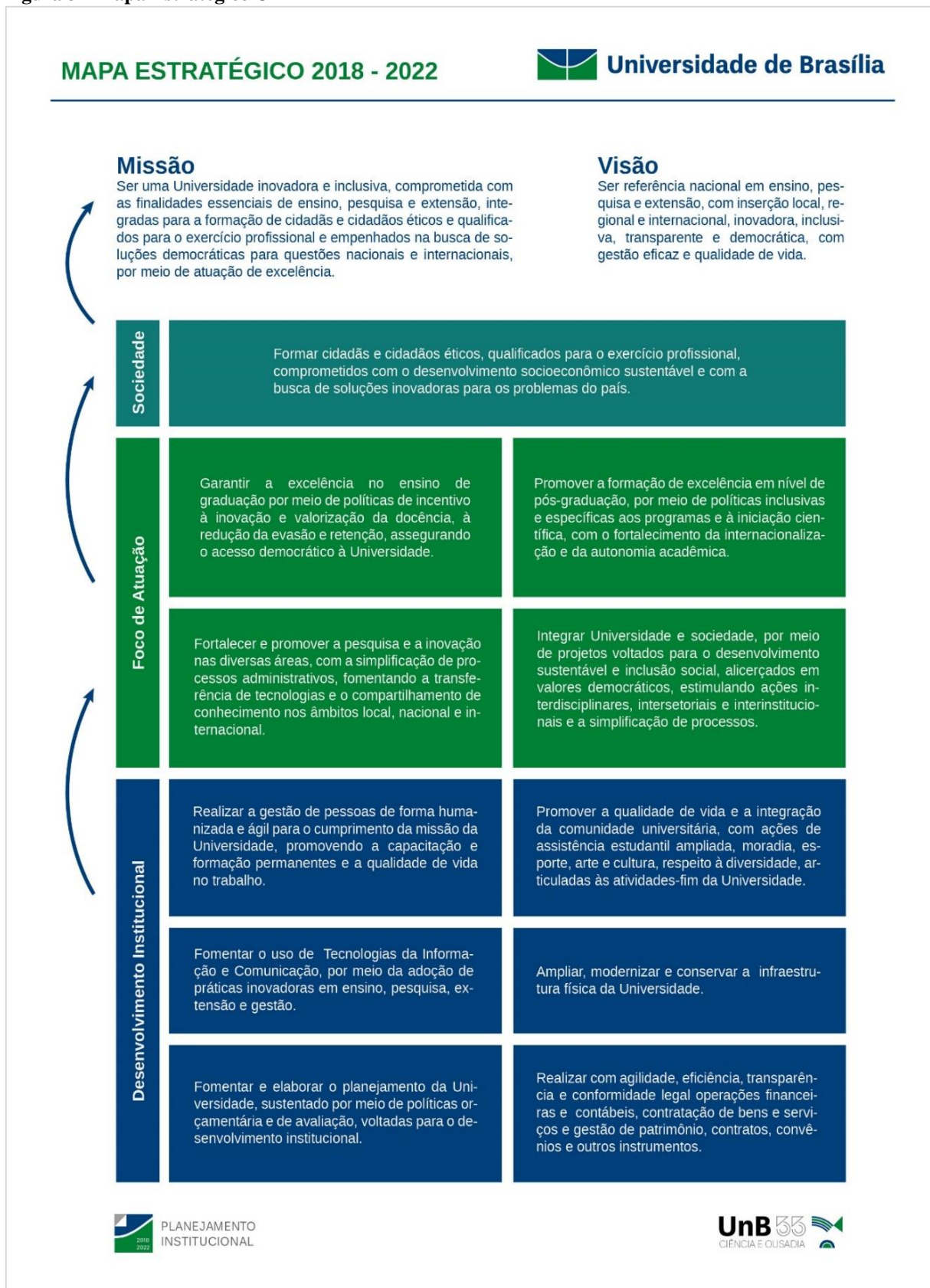
Figura 3 - Mapa Estratégico UnB