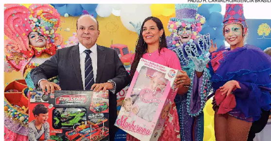
No dia D, o governador e a primeira-dama distribuíram os brinquedos

De acordo com a primeira-dama, o GDF está mapeando instituições que existem na capital federal, tanto as vinculadas ao governo, quan-