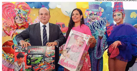
No dia D, o governador e a primeira-dama distribuíram os brinquedos

De acordo com a primeira-dama, o GDF está mapeando instituições que existem na capital federal, tanto as vinculadas ao governo, quan-