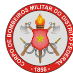
CORPO DE BOMBEIROS MILITAR DO DF