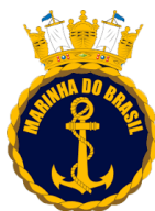
MARINHA DO BRASIL