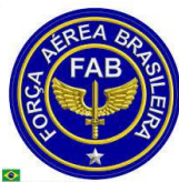
FORÇA AÉREA BRASILEIRA