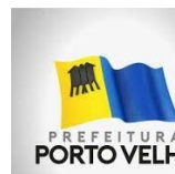
PREFEITURA DE PORTO VELHO