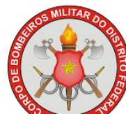
CORPO DE BOMBEIROS MILITAR DO DF