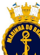
MARINHA DO BRASIL