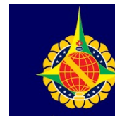
POLÍCIA MILITAR DO DF