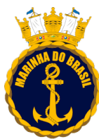
MARINHA DO BRASIL