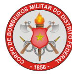
CORPO DE BOMBEIROS MILITAR DO DF