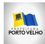
PREFEITURA DE PORTO VELHO