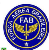
FORÇA AÉREA BRASILEIRA