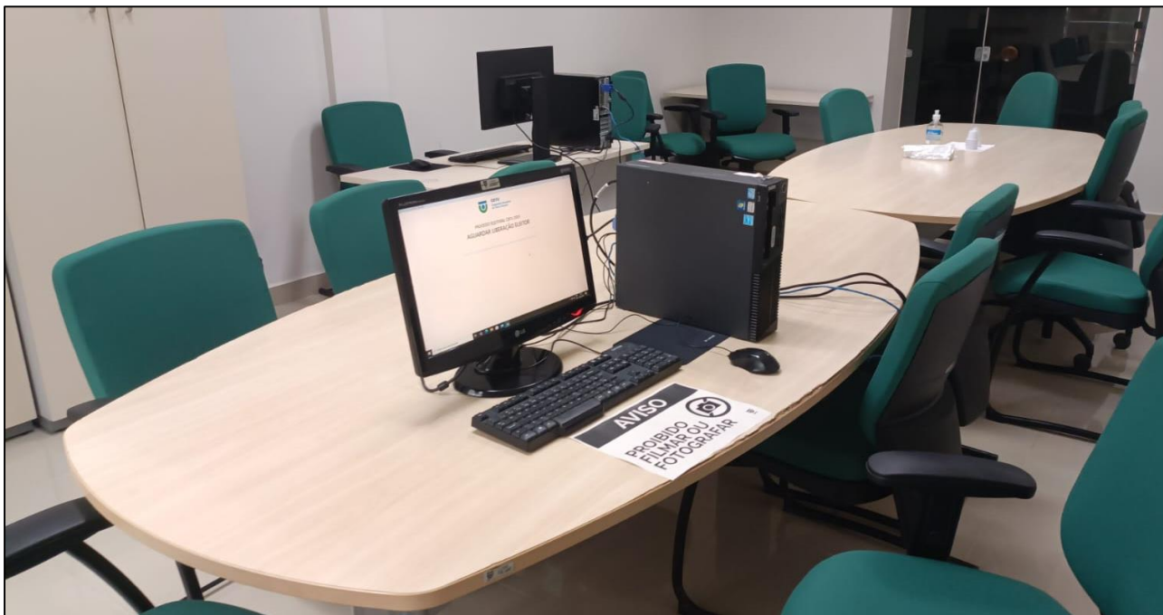
Figura 2: Local de votação, na sala de Reuniões do prédio de Recursos Humanos. Em destaque a urna de votação, ao fundo o computador do mesário.