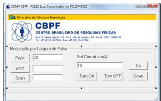
Figura 1 – Operação laser CPS180 conectado ao circuito eletrônico responsável por controlar a corrente elétrica do laser e interface visual do programa.