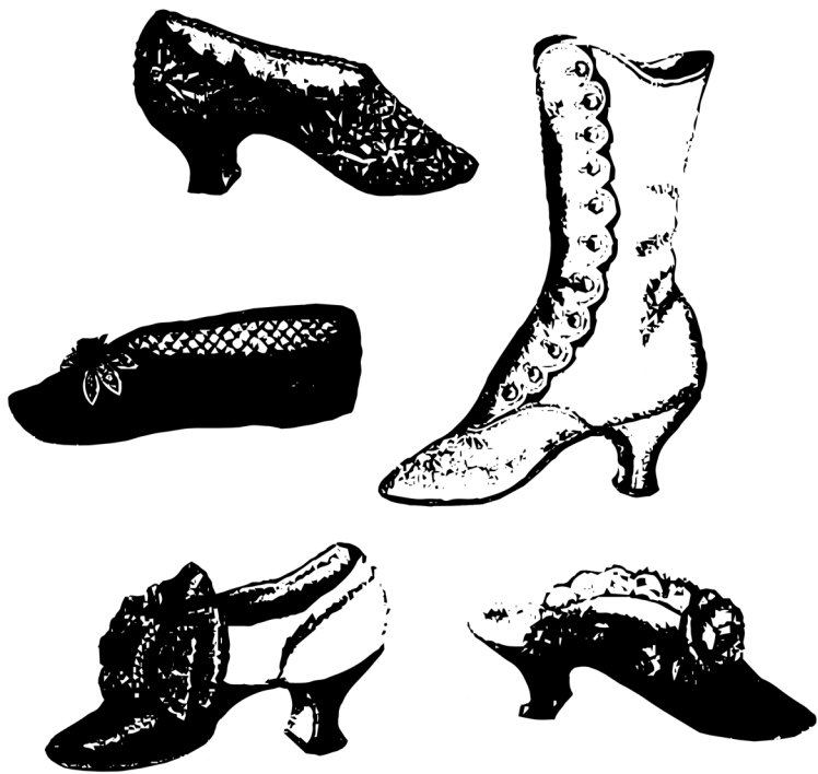
Figura 5: Variados modelos de calçados femininos utilizados no final do século XIX.