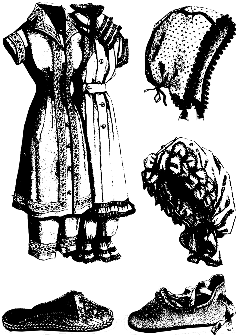
Figura II: Traje de banho, toucas de banho e calçados para banho.