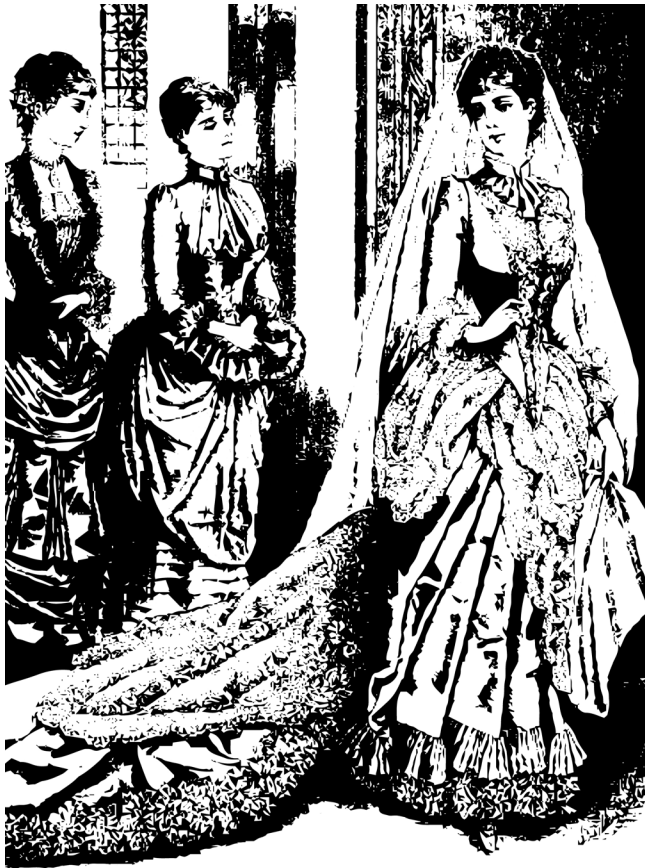
Figura 7: Em primeiro plano, vestido de noiva e, em segundo plano, vestidos de festa.