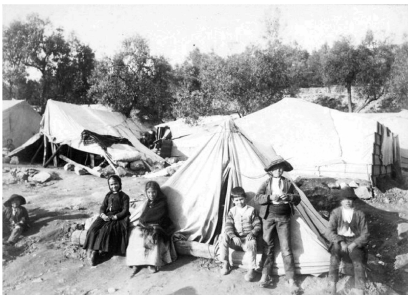
Figuras 16 e 17: Escombros causados pelo terremoto de 1894, na região da Andaluzia, Espanha.