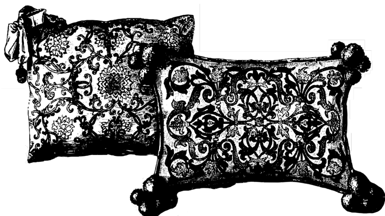
Figura 13: Almofadas bordadas.