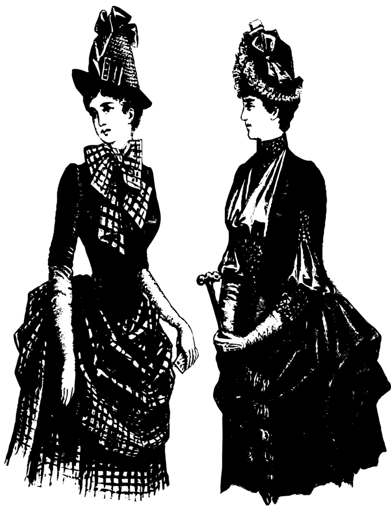
Figura 2: Diferentes estilos de barretinas.