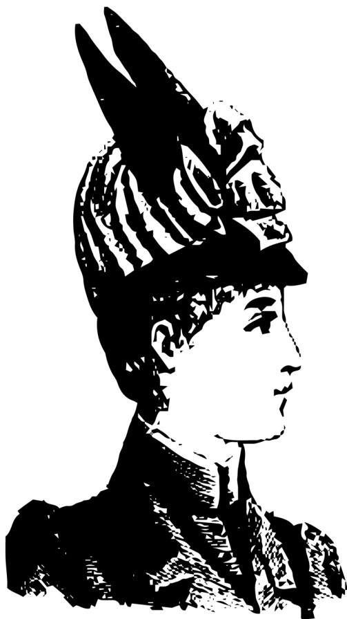
Figura 4: Bonnet de jockey.