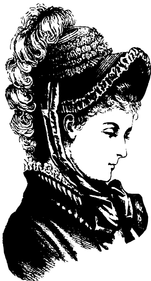
Figura 3: Chapéu cabriolet .