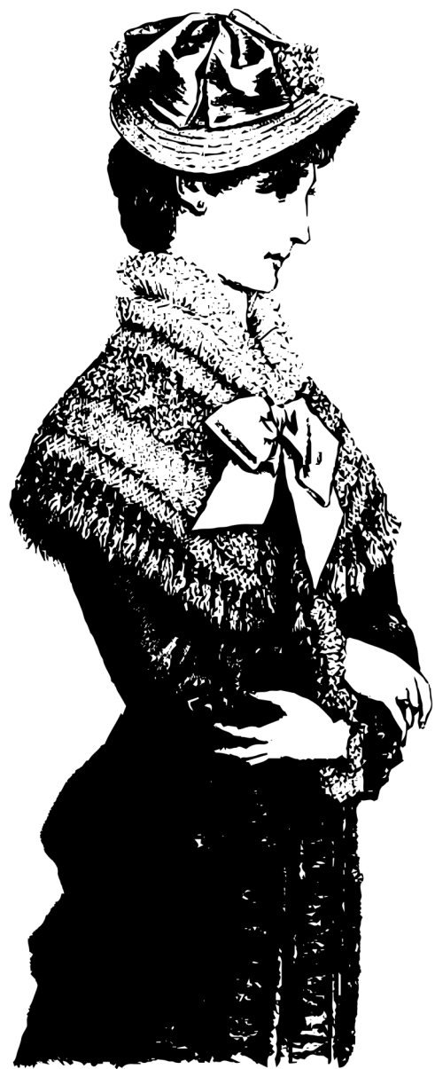
Figura 1: Chapéu à Niniche.