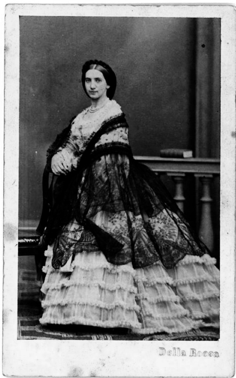
Figura 11: Princesa Della Rocca.