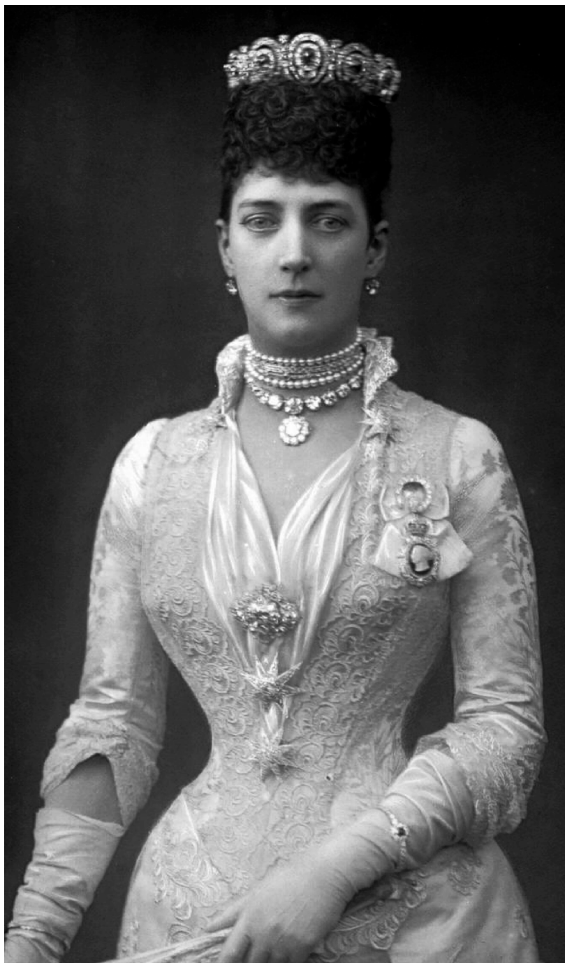
Figura 11: Alexandra da Dinamarca.