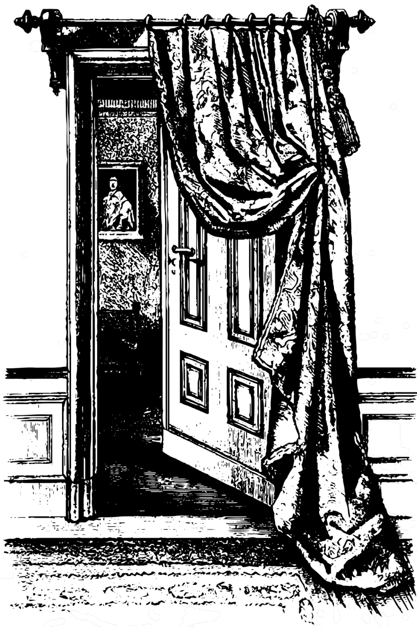
Figura 14: Reposteiro bordado.