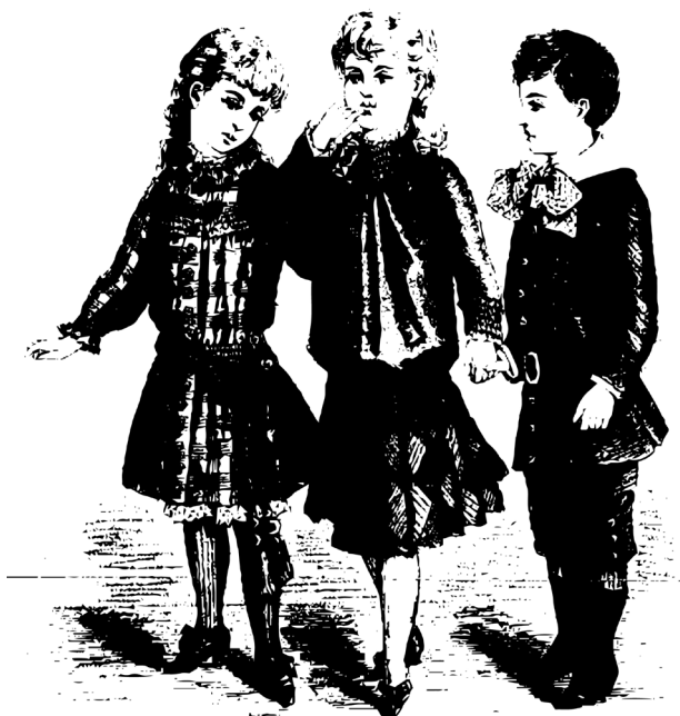
Figuras 8 e 9: Alguns modelos de vestimentas infantis do final do século XIX.