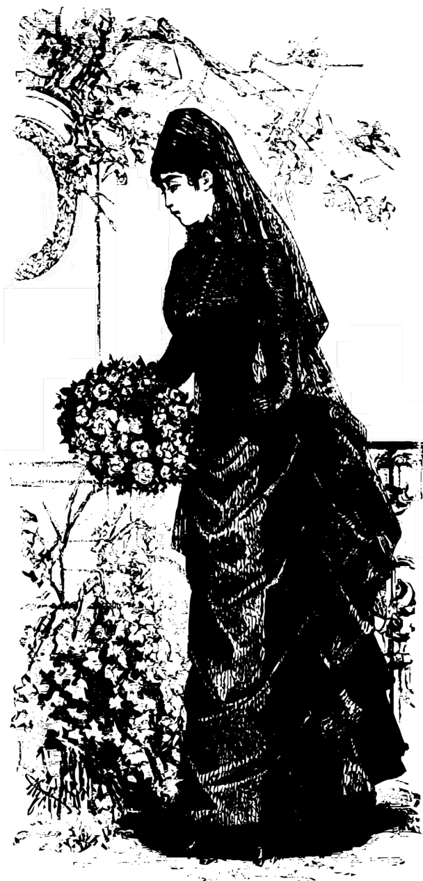
Figura 10: Vestimenta de luto.