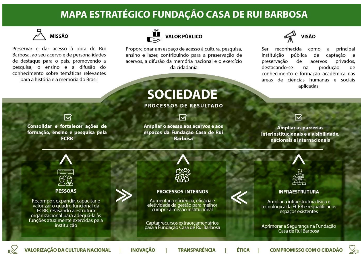
Figura 2: Quadro do Planejamento Estratégico da FCRB