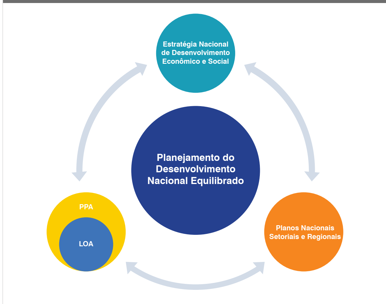
FIGURA 1 – ESTRUTURA DO PLANEJAMENTO DO DESENVOLVIMENTO NACIONAL EQUILIBRADO

Todos esses elementos, assim como as diretrizes e indicadores, fazem parte de um instrumento não estático. A estratégia nacional , como consta do projeto de lei, pode ser revista em duas situações: i) ordinariamente, a cada quatro anos, por ocasião do encaminhamento do projeto de lei do plano plurianual; e ii) extraordinariamente, na ocorrência de circunstâncias excepcionais. Além de garantir que o planejamento reflita as opções democraticamente estabelecidas pela população, a maleabilidade do instrumento permitirá a adaptação às mudanças inesperadas de contexto.