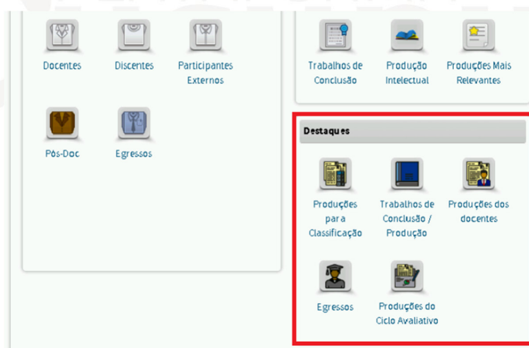
Figura 1. Módulo de destaques na Plataforma Sucupira

Conforme apresentado no Boletim Informativo nº 38 disponível na Plataforma Sucupira (Portal do Coordenador > Apoio ao preenchimento > Boletins), o perfil do Coordenador de Programa de Pós-graduação conta com o módulo de Destaques, no qual os programas poderão, após preencherem todas as informações no Coleta, marcar quais produções e egressos são destaques. ( Figura 1 ).