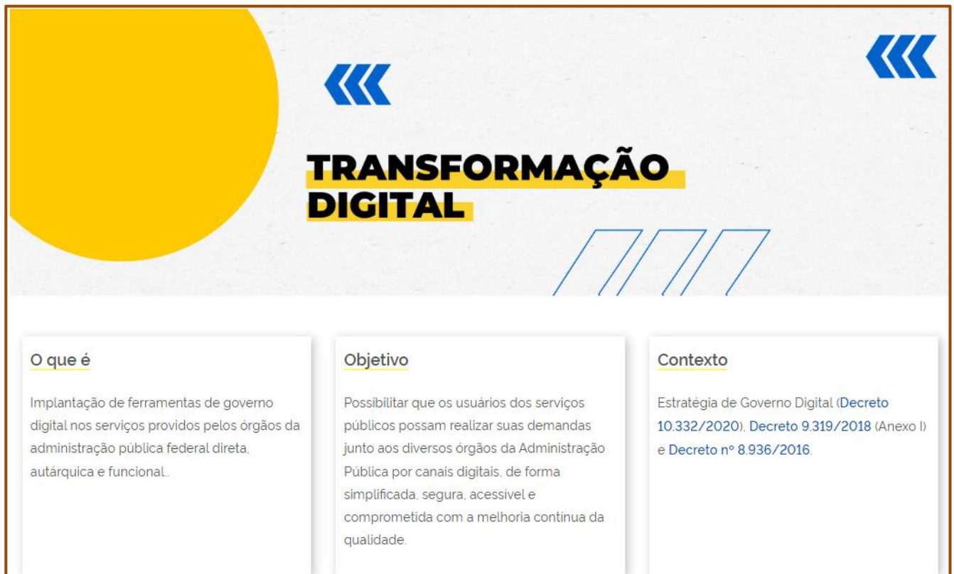
Imagem 1: Recorte retirado do site do Governo Digital