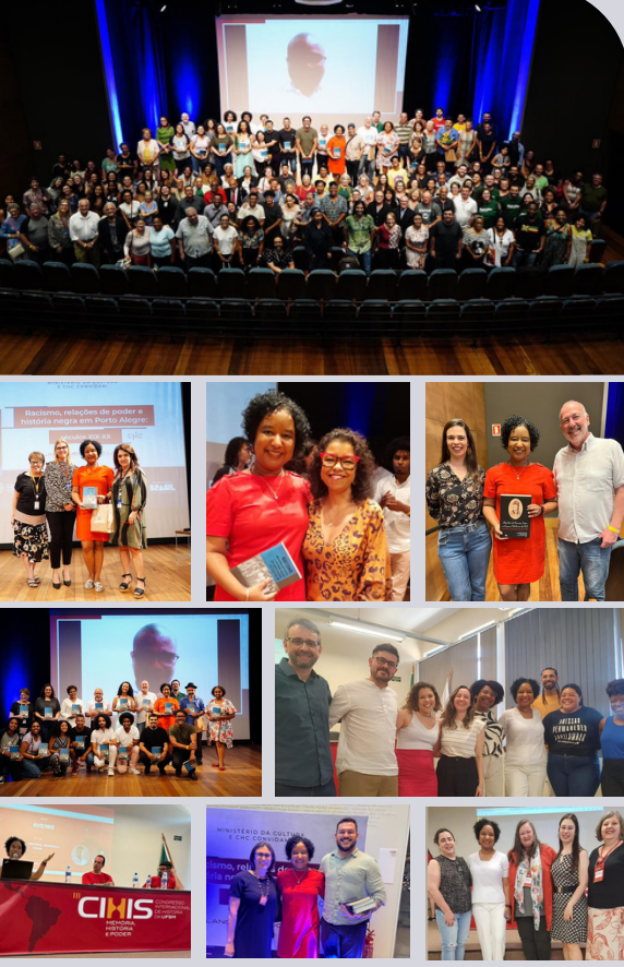
Legenda das fotos, da esquerda para a direita, por fila: