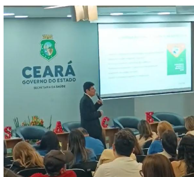
Dia Nacional e Estadual na Vigilância Sanitária no Ceará