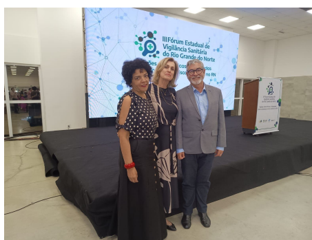
III Fórum Estadual de Vigilância Sanitária do Rio Grande do Norte