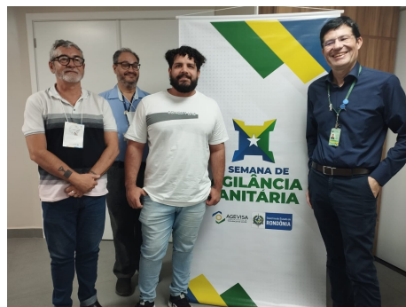
6ª Semana de Vigilância Sanitária do Estado de Rondônia