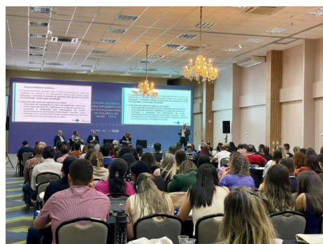
Oficina Regional em Cuiabá-MT