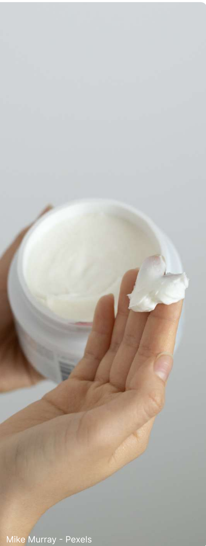
Mike Murray - Pexels