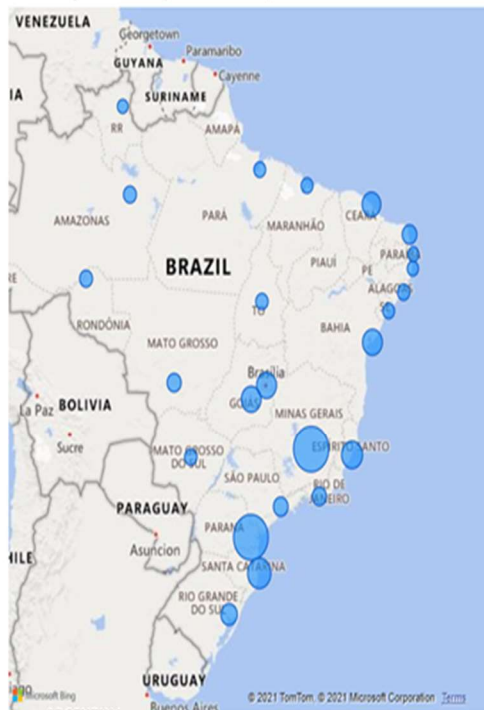
Distribuição de Serviços de Diálise por Estado

O Serviço de diálise atende pacientes em diálise peritoneal