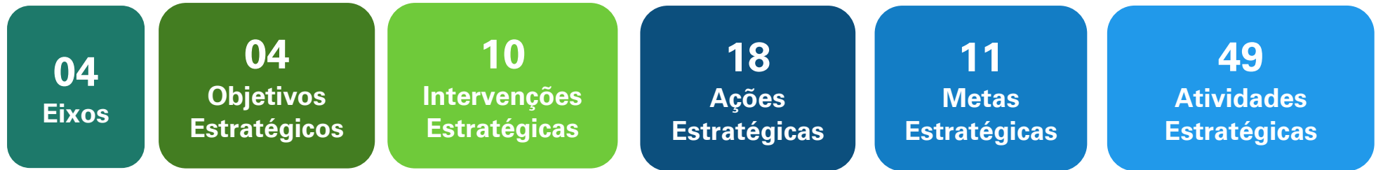
Figura 1 - Resumo do PAN-SERVIÇOS DE SAÚDE 2017-2021