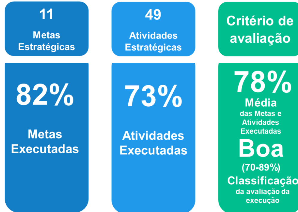
Figura 2 – Avaliação do PAN-SERVIÇOS DE SAÚDE 2017-2021