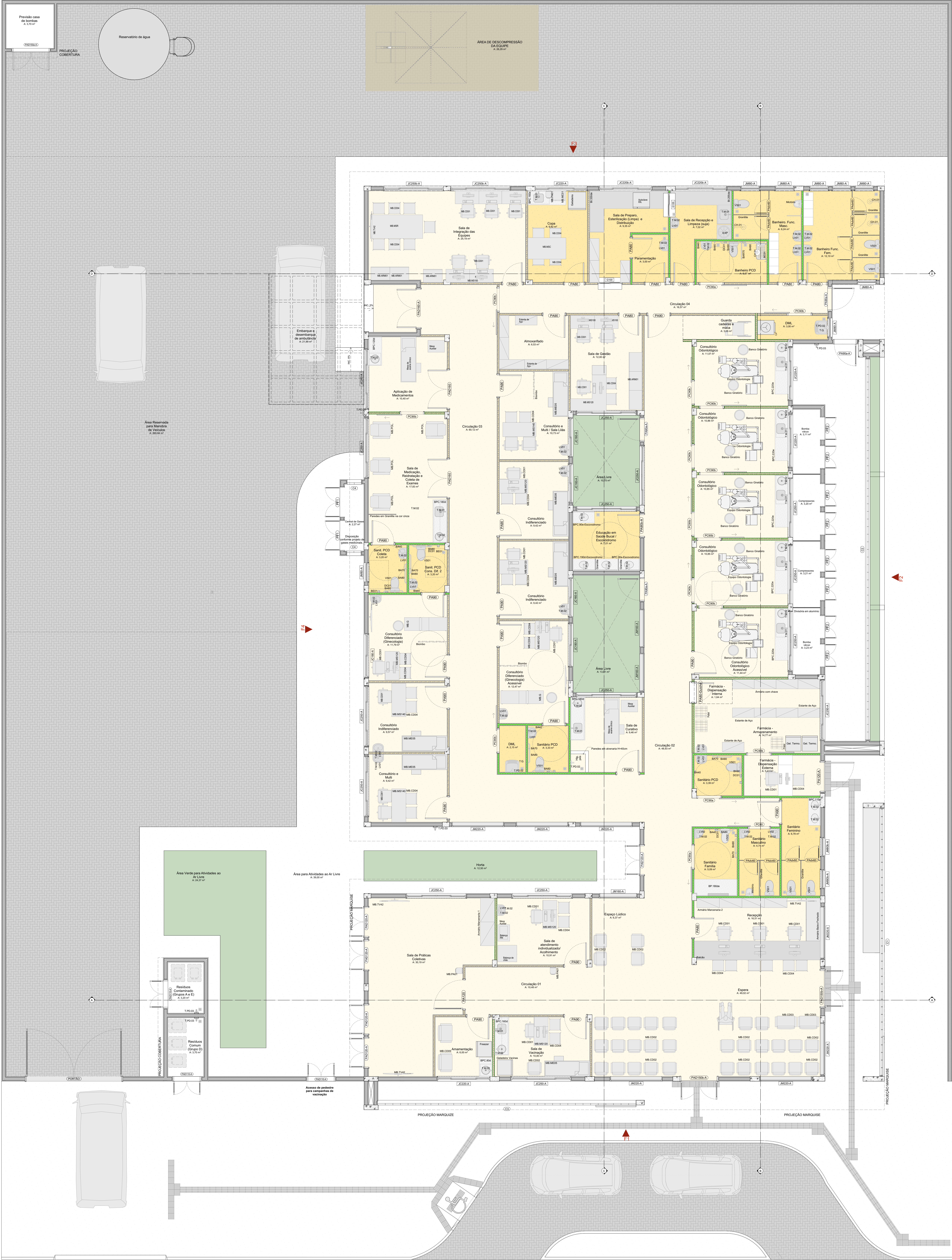
PLANTA DE LAYOUT