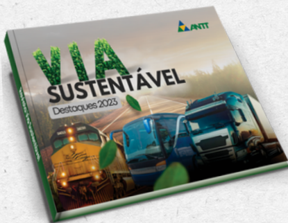
Revista Via Sustentável Destaques 2023