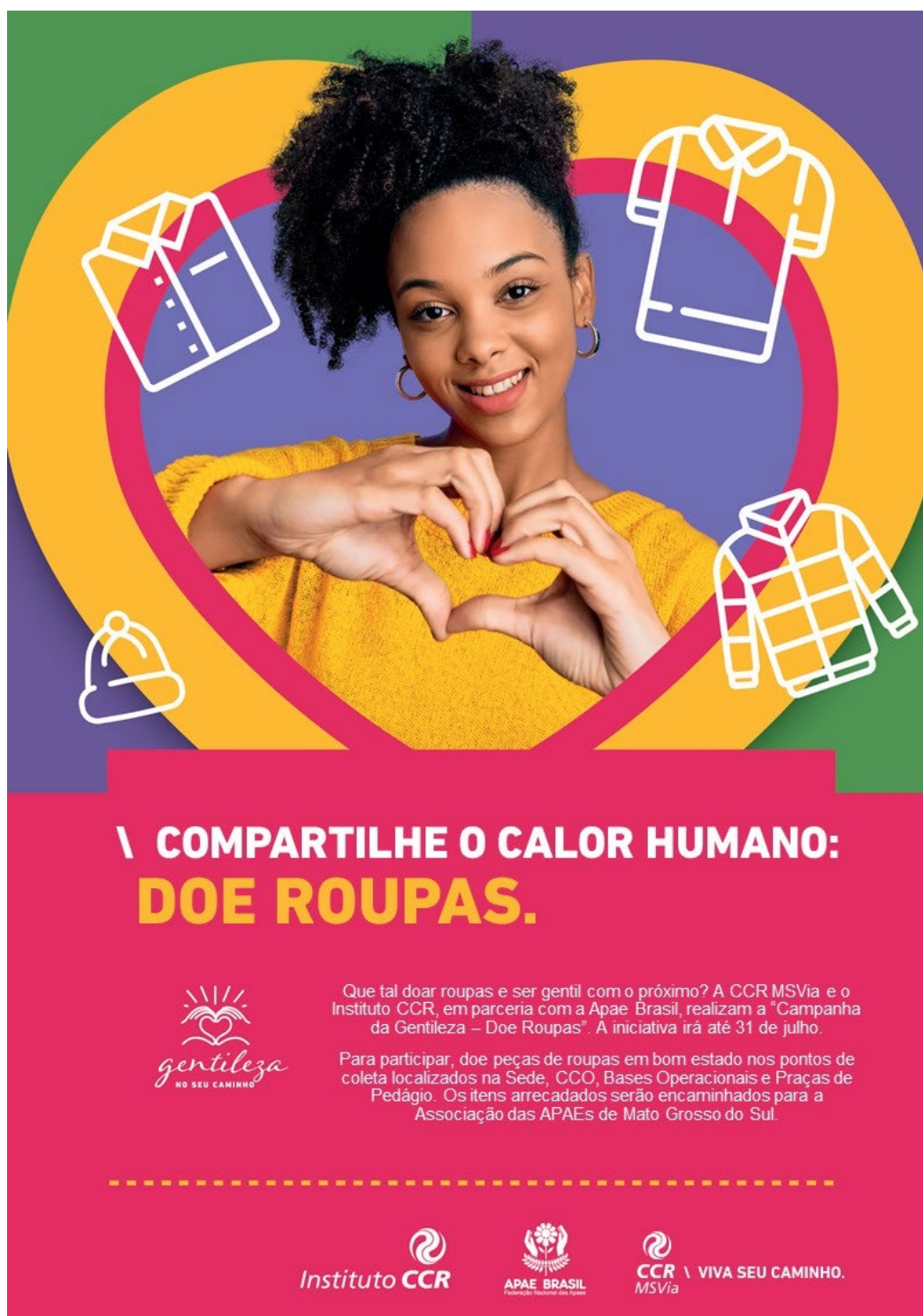
Figura 2 - Compartilhe o calor humano: Doe Roupas