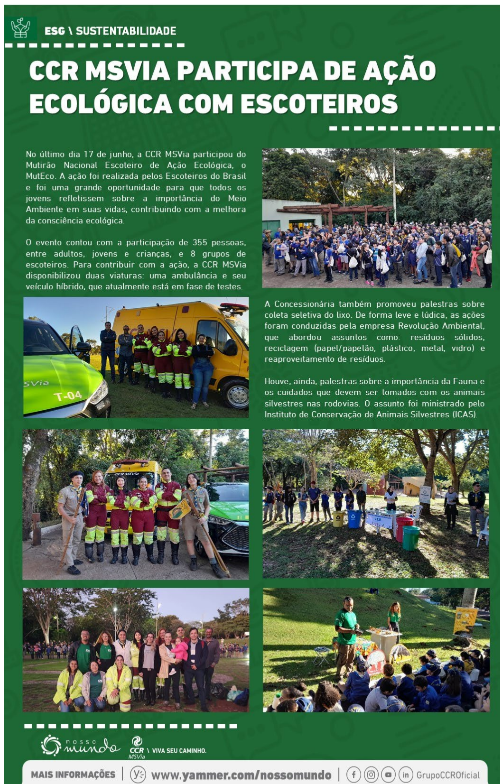
Figura 8 - CCR MSVia participa de ação ecológica com escoteiros