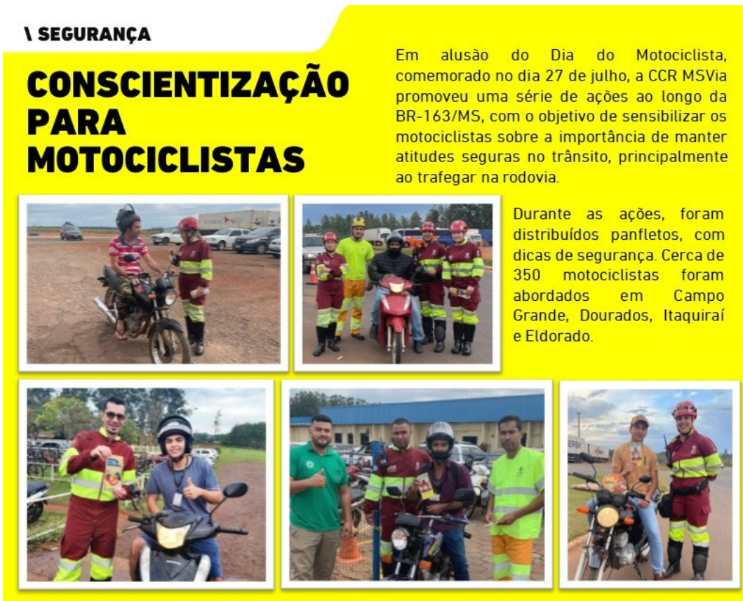
Figura 5 - Conscientização para Motociclistas