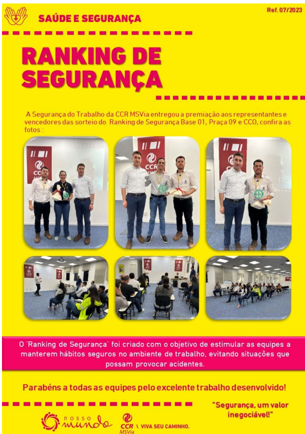
Figura 3 - Ranking de Segurança