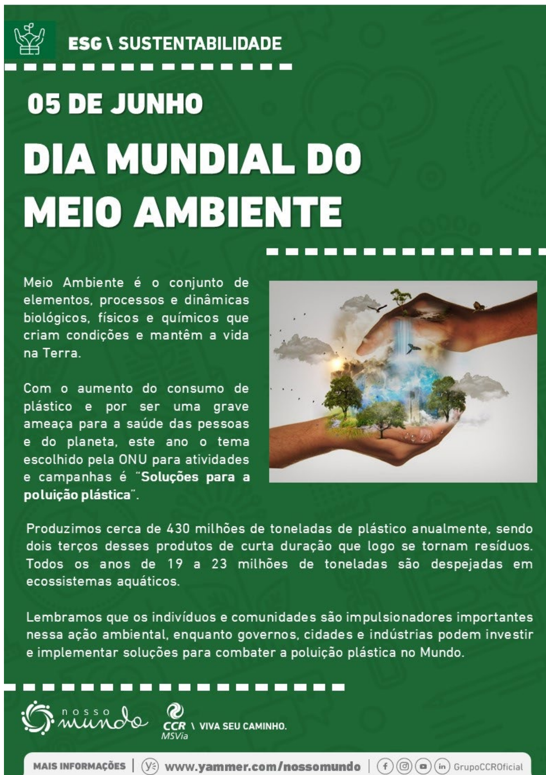
Figura 7 – Dia Internacional do Meio Ambiente