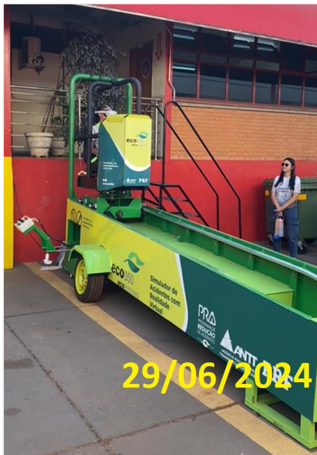
Figura 17: uso do simulador de tombamento durante a 3ª Corrida dos Bombeiros, em Uberlândia-MG.