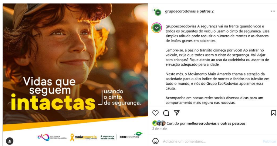
Figura 16: postagem de 02 de maio sobre a importância do uso do cinto de segurança.