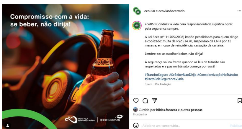
Figura 20: postagem de 8 de junho de prevenção à embriaguez ao volante.