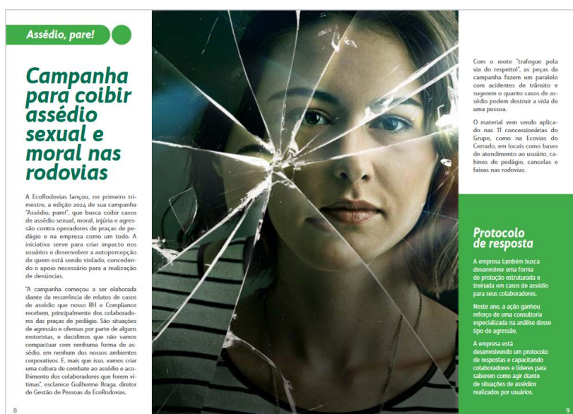
Figura 4: matéria sobre a campanha “Assédio, pare!”.

Ainda em março, a concessionária lançou uma nova edição da sua revista trimestral, referente aos meses de março, abril e maio. A publicação trouxe uma matéria sobre a campanha “Assédio, Pare!”, no intuito de divulgar informações sobre a ação e conscientizar os usuários sobre os diversos tipos de assédio. A revista tem versão impressa e online, que pode ser conferida pelo link: https://tinyurl.com/ECCmar24 .