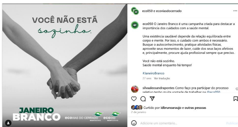
Figura 1: Peça para divulgação do Janeiro Branco. Postagem de 02/01/2024.

A unidade não realizou ações presenciais naquele mês.