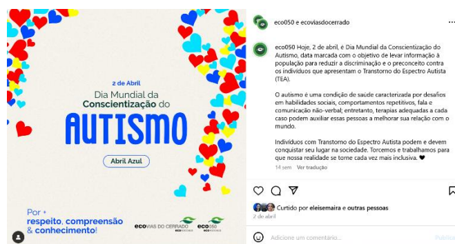
Figura 9: Postagem de 2/04 sobre o Dia de Conscientização do Autismo, com 737 contas alcançadas.

Não foram realizadas ações presenciais naquele mês.