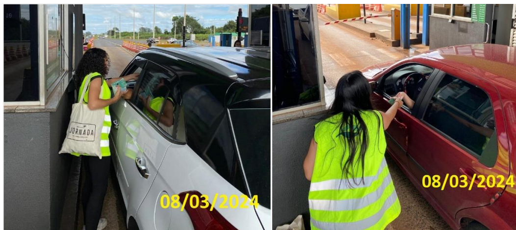
Figuras 8: distribuição de brindes e materiais informativos na Praça de Uberlândia durante ação pelo Dia Internacional da Mulher.