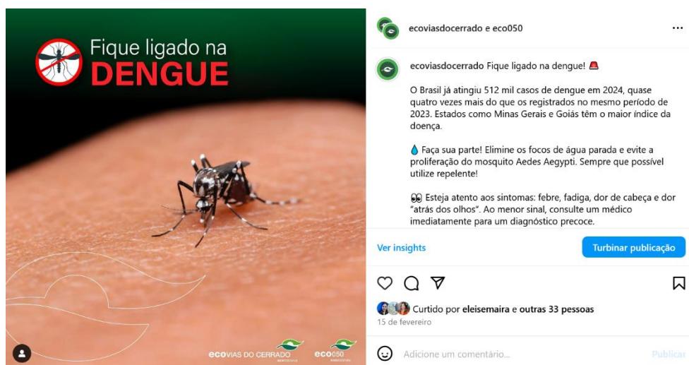
Figura 3: postagem de 15/02/2024 de conscientização sobre a dengue.