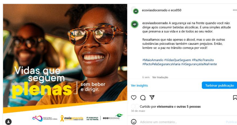
Figura 14: peça de 30 de maio com mensagem de prevenção à embriaguez ao volante.