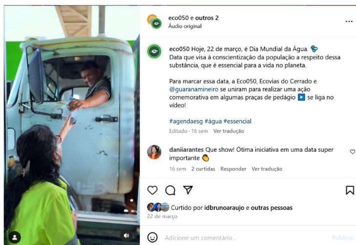
Figura 5: postagem de 22 de março sobre a ação do Dia Mundial da Água.