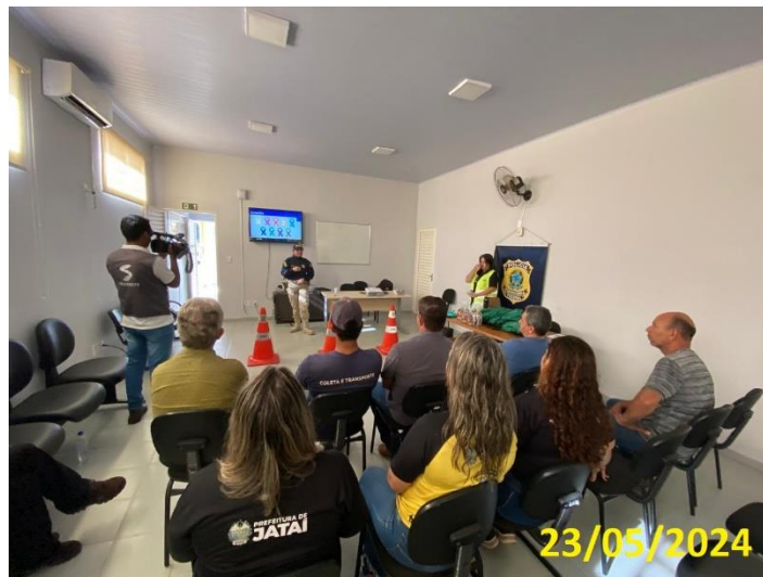
Figura 12: orientação de usuários durante blitz educativa na PRF de Jataí.