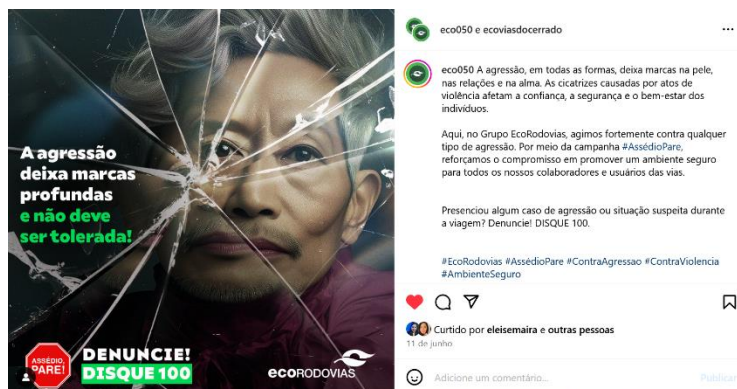
Figura 19: postagem de 11 de junho sobre a campanha “Assédio, Pare!”.