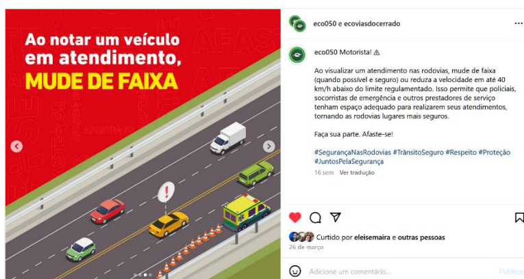
Figura 7: postagem de 26 de março de reforço à campanha “Afaste-se!”.