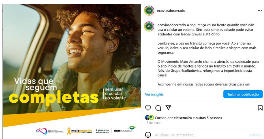
Figura 15: postagem de 13 de maio com mensagem de prevenção ao uso do celular ao volante.