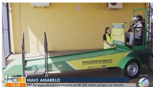
Figura 11: ação de abertura pelo Maio Amarelo na PRF de Uberlândia; simulador de impacto foi tema de reportagem.

Além das ações presenciais, as campanhas pelo Maio Amarelo também foram multiplicadas nas redes sociais, com postagens educativas sobre o uso do cinto de segurança, os perigos do uso do celular ao volante e o respeito aos limites de velocidade.