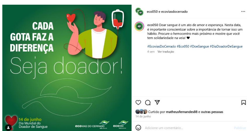
Figuras 21: postagem de 14 de junho, em collab com a Eco050, sobre o Dia do Doador de Sangue.