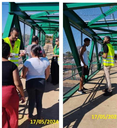
Figuras 13: abordagens aos usuários durante ação em passarela de Monte Alegre de Minas .