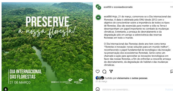
Figura 6: postagem do dia 21 de março sobre o Dia Internacional das Florestas.