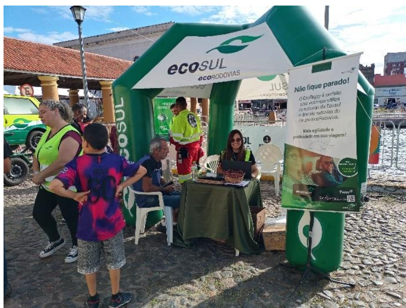
Figura 7 - Estrutura para oferecimento de EcoTAG