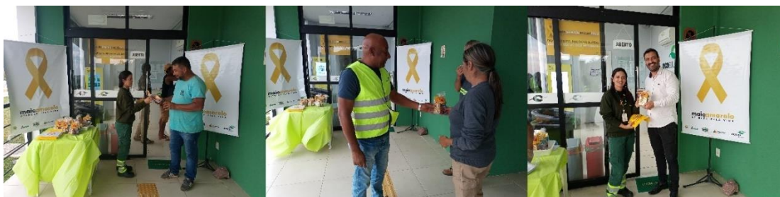
Figura 47 - Conversa sobre segurança viária