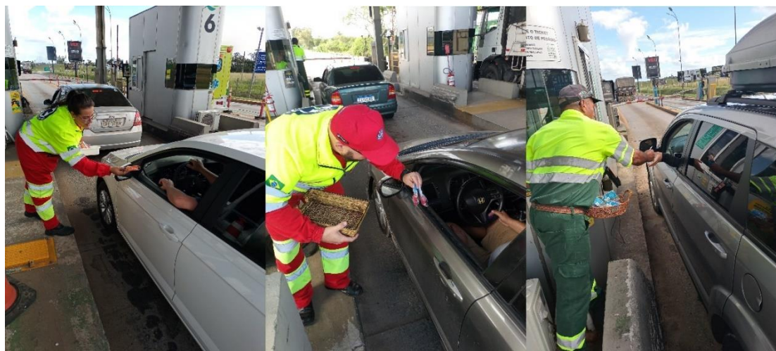
Figura 36 - Entrega de lembrancinhas com dicas de trânsito