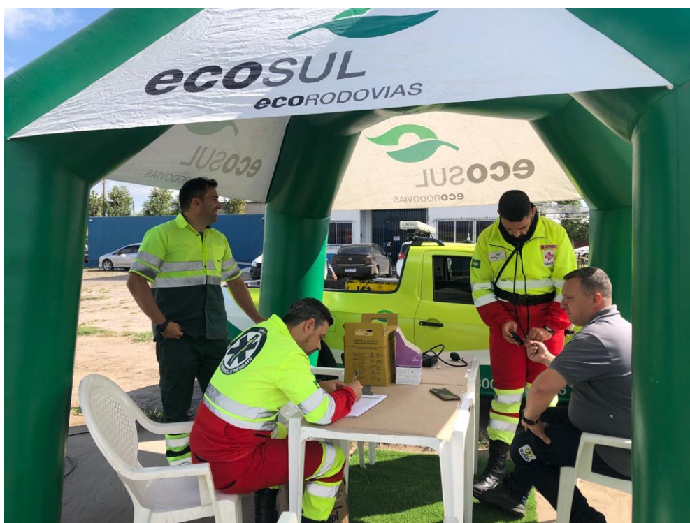
Figura 3 - Ação do Saúde na Estrada