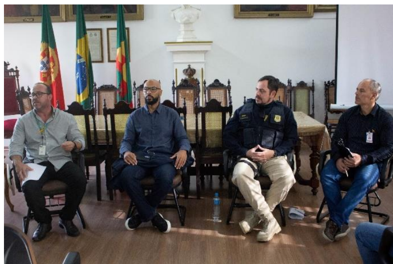
Figura 49 - Conversa sobre segurança no trânsito