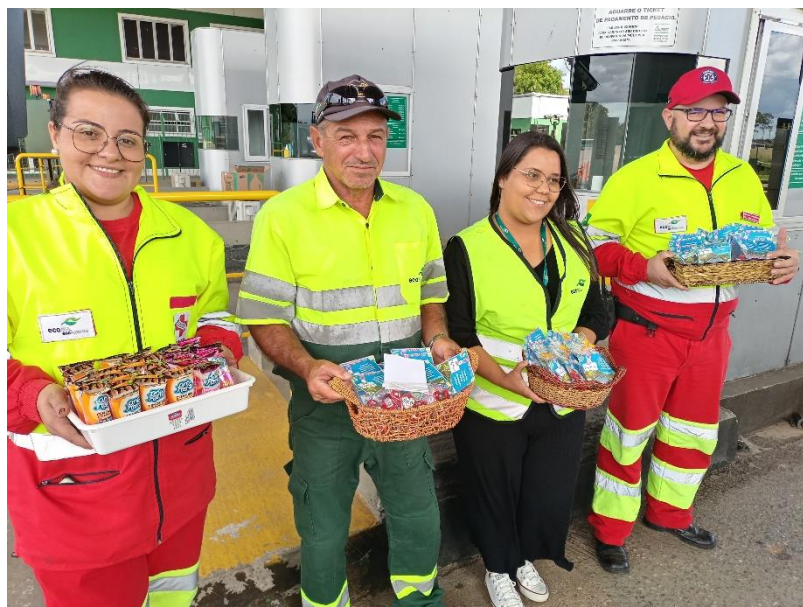
Figura 34 - Equipes com as lembrancinhas do evento