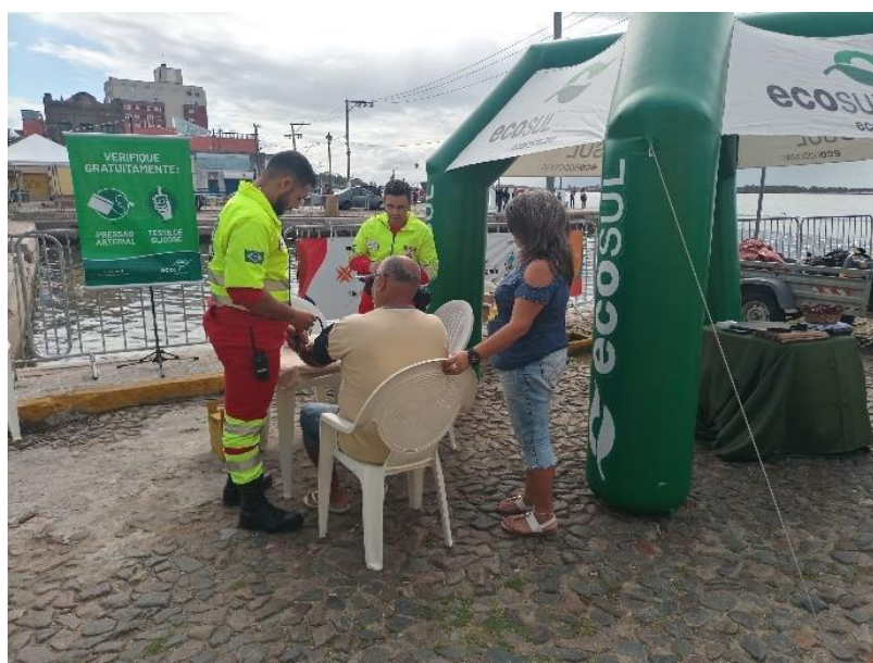
Figura 6 - Verificação de pressão e glicose