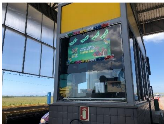
Figura 27 - Decoração das pistas de pedágio

Entre os dias 17 e 21 de fevereiro a Ecosul realizou ação alusiva ao carnaval 2023. As Praças e SAU's foram decorados com adereços carnavalescos com o tema “Carnaval Ecosul – folia e cuidado”, as ações foram norteadas por ações educativas como: “História de carnaval divertida, não envolve direção e bebida” e “Carnaval é curtidão, mas, respeite quem te disser não!”, figura 27. Nos dias 17 e 18 de fevereiro uma equipe da concessionária e artistas circenses realizaram a entrega de kits folia, que continham pacotes de confetes, ventarolas, camisinhas e folhetos educativos, nas Praças Capão Seco (BR-392/RS km 52) e Retiro (BR-116/RS km 511), como mostrado nas figuras 28, 29 e 30. No dia 21 de fevereiro uma equipe da Ecosul realizou a entrega de copos de água aos usuários na Praça Capão Seco (BR-392/RS km 52).