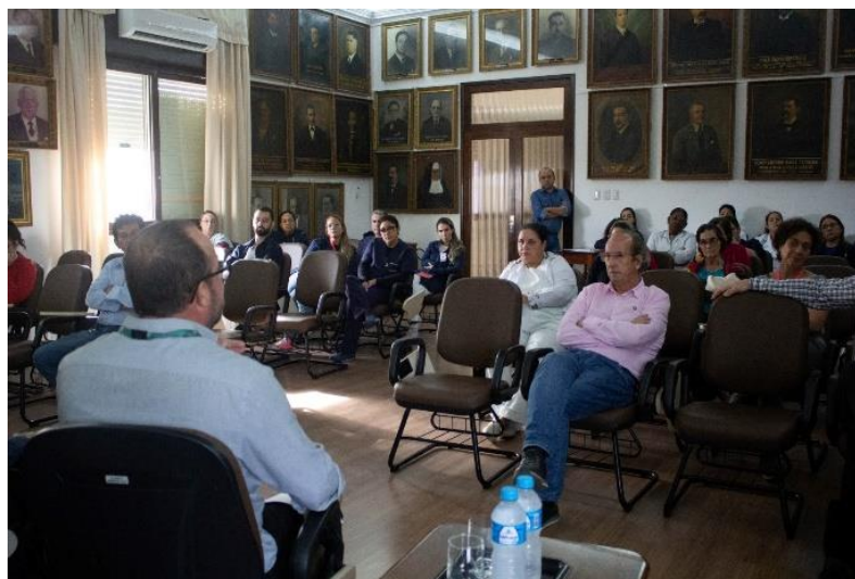
Figura 50 - Conversa sobre segurança no trânsito