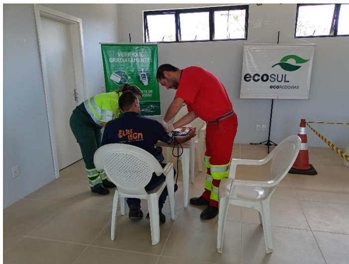
Figura 21 - Verificação de pressão e glicose

Ação Operação Verão realizada no dia 10 de fevereiro de 2023 no SAU Canguçu, BR-392/RS km 125, com atendimento a 46 pessoas.