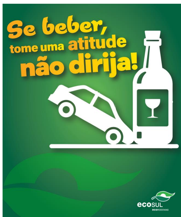
Figura 17 - Layout da campanha Operação Verão Ecosul