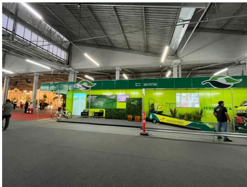
Figura 10 - Estande Ecosul na Fenadoce