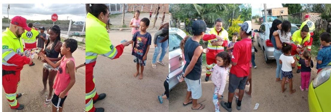
Figura 38 - Distribuição das lembranças