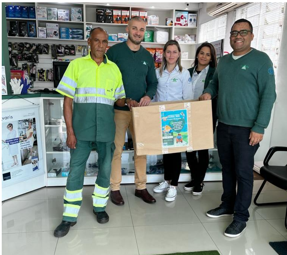
Figura 4 - Campanha do Agasalho Ecosul