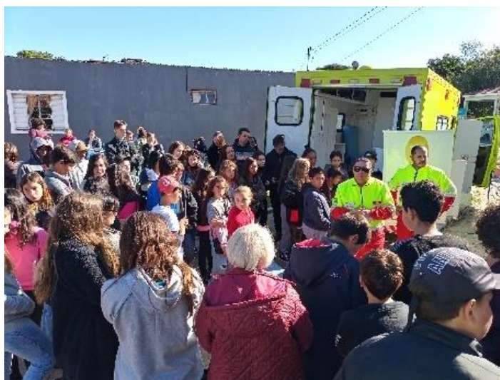
Figura 57 - Conversa sobre Primeiros Socorros