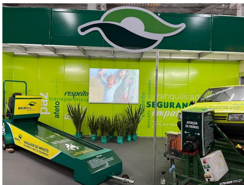
Figura 8 - Simuladores Ecosul na Fenadoce