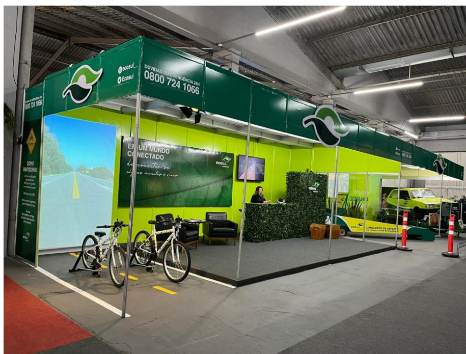
Figura 11 - Estande Ecosul na Fenadoce