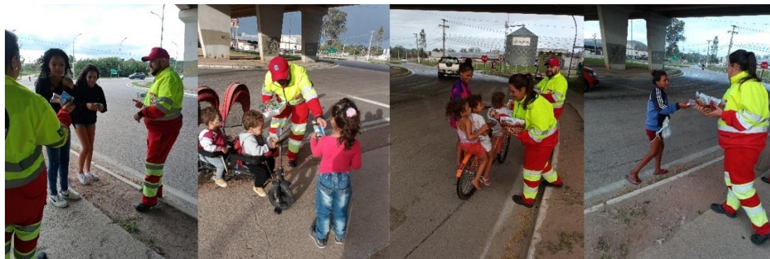
Figura 39 - Distribuição das lembranças