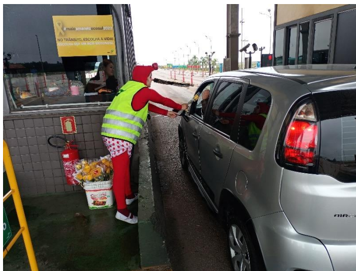
Figura 62 - Distribuição de flores