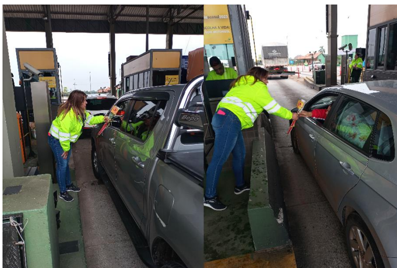
Figura 61 - Distribuição de flores