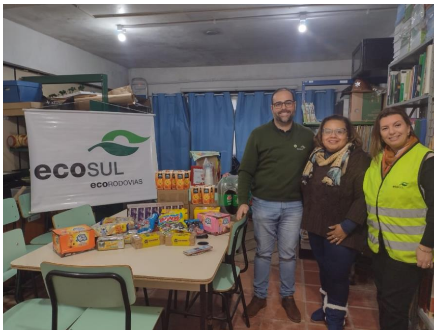
Figura 16 - Doação dos alimentos e bebidas