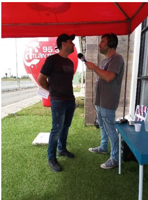
Figura 31 - Conversa com a coordenação da Ecosul