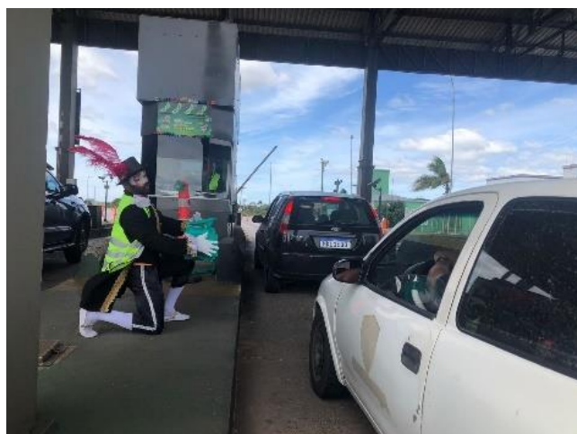
Figura 29 - Entrega de kits aos usuários