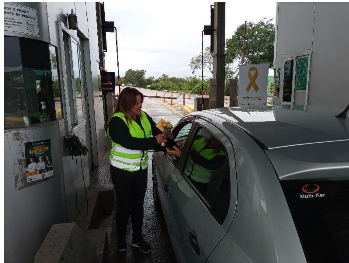
Figura 42 - Distribuição de flores