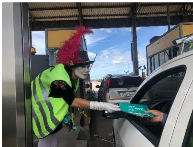
Figura 28 - Entrega de kit aos usuários