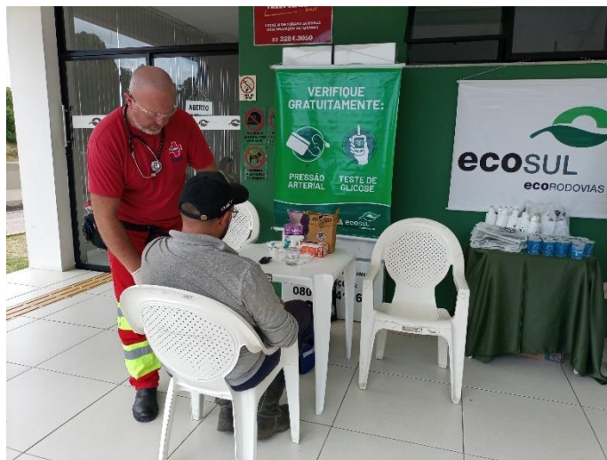
Figura 19 - Verificação de pressão e glicose

Ação Operação Verão realizada no dia 20 de janeiro de 2023 no SAU Turuçu, BR-116/RS km 492, com atendimento a 45 pessoas.