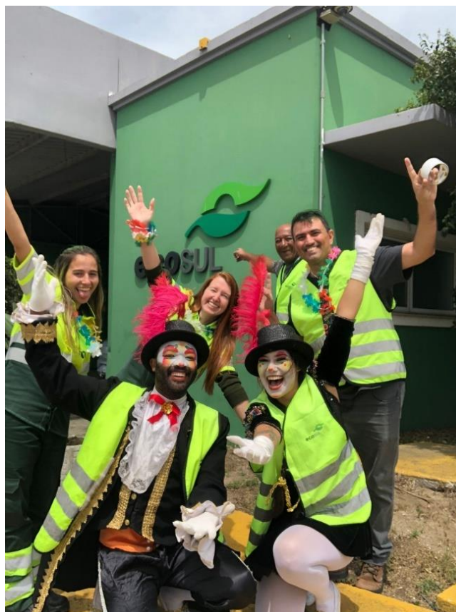
Figura 30 - Equipe caracterizada que realizou a ação