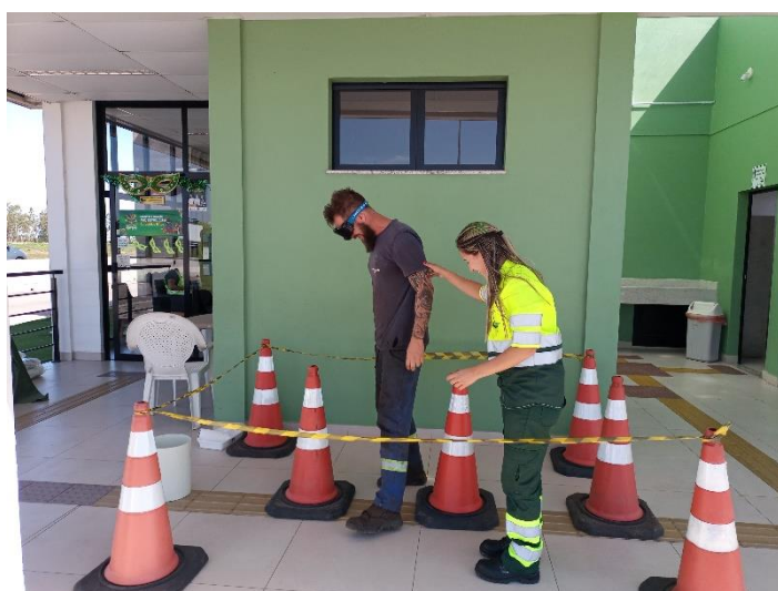
Figura 22 - Atividade com simulador de embriaguez

Ação Operação Verão realizada no dia 17 de fevereiro de 2023 no SAU Rio Grande, BR-392/RS km 33, com atendimento a 46 pessoas.