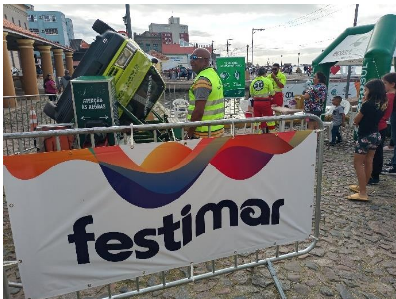
Figura 5 - Atividade com simuladores