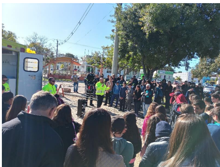
Figura 55 - Conversa sobre segurança viária