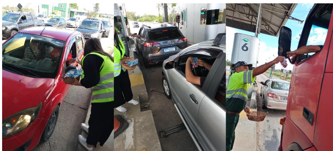
Figura 35 - Entrega de lembrancinhas com dicas de trânsito