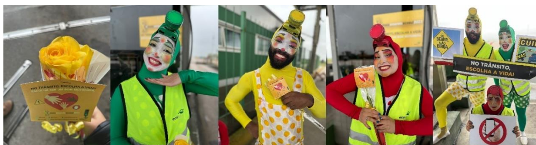
Figura 58 - Flores distribuídas por artistas circenses

(ANTT). Também, participaram personagens circenses caracterizados nas cores do semáforo, como mostrado nas figuras 58, 59, 60, 61 e 62.