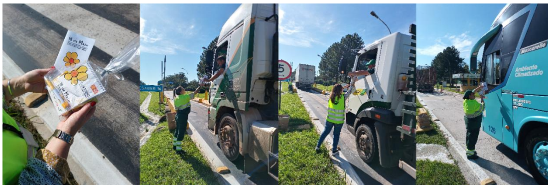
Figura 63 - Distribuição de material alusivo à data