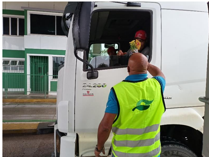
Figura 43 - Distribuição de flores