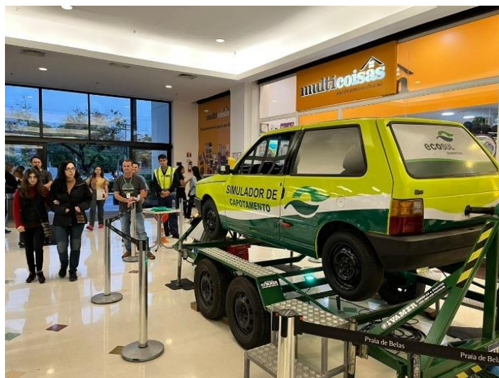
Figura 51 - Atividade com o simulador de capotamento