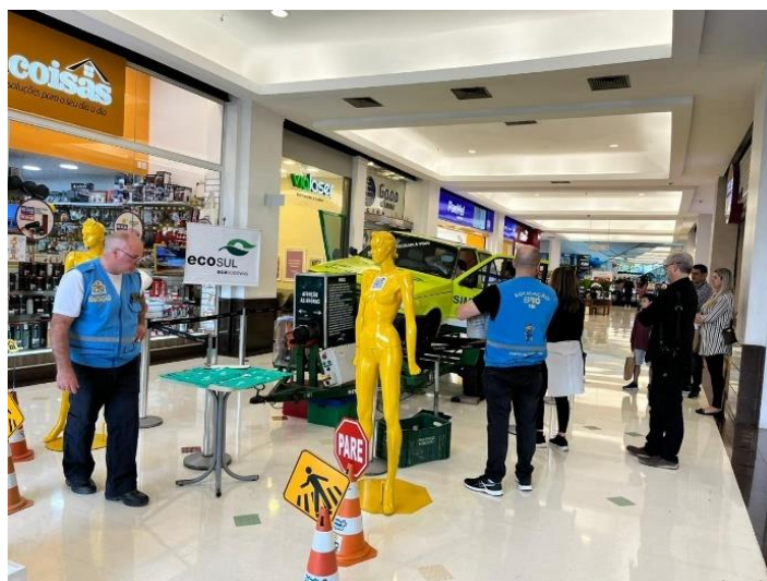
Figura 52 - Atividade com o simulador de capotamento