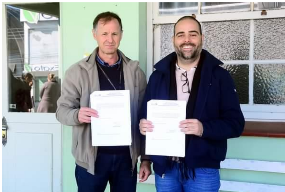
Figura 15 - Recibos de doação