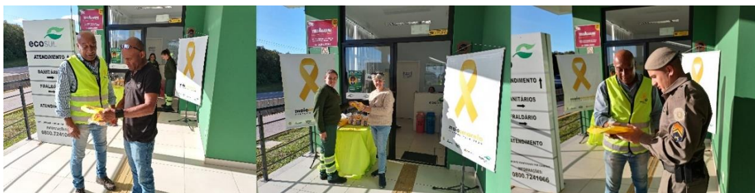
Figura 46 - Conversa sobre segurança viária