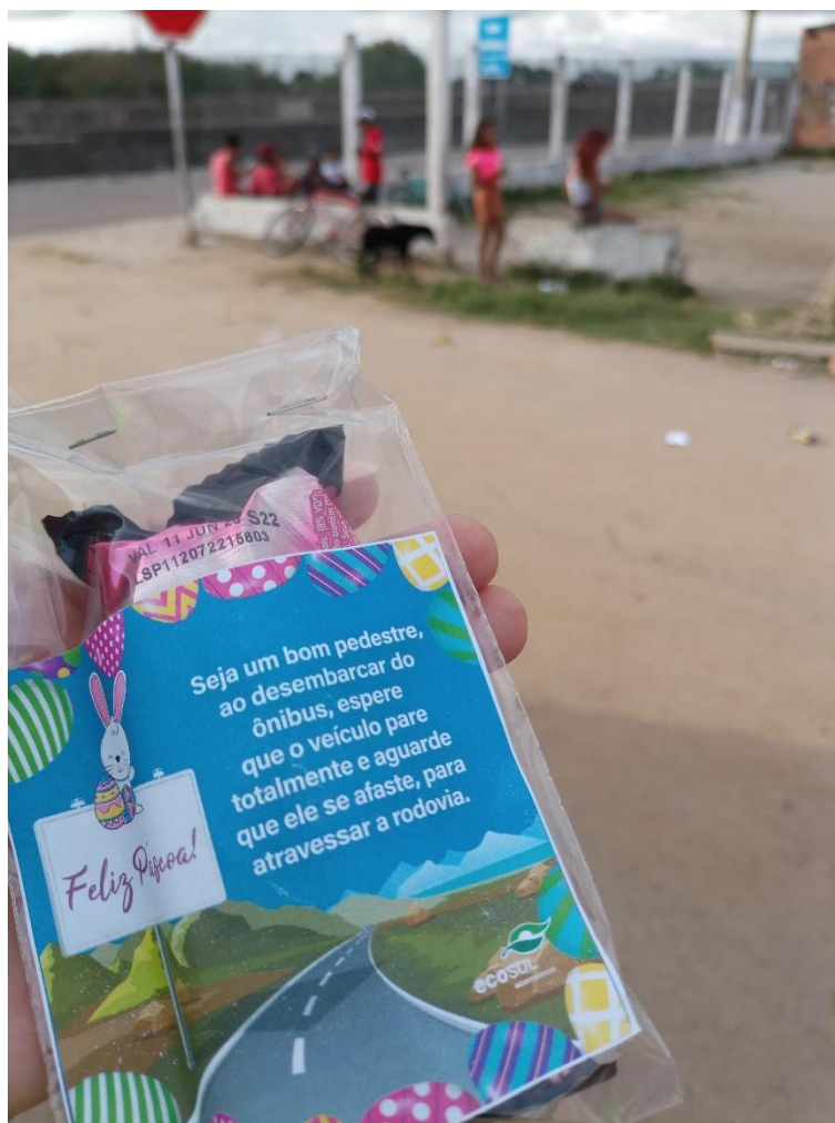
Figura 37 - Lembrança com dica de segurança