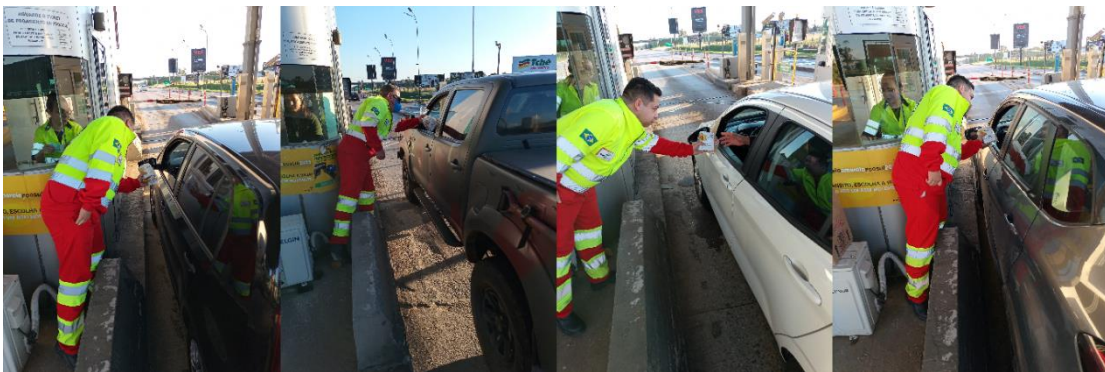
Figura 65 - Distribuição de material alusivo à data