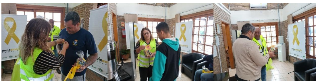
Figura 45 - Conversa sobre segurança viária