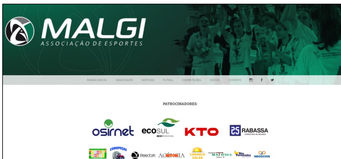
Figura 14 - Site do Malgi, onde consta a Ecosul como patrocinadora

menor poder aquisitivo. Contribuindo para o empoderamento feminino, visto que a pratica do futsal/futebol ainda é predominantemente masculino.