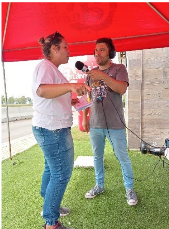
Figura 33 - Conversa com a gerência