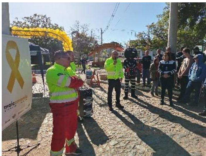
Figura 54 - Conversa sobre segurança viária

Foi realizada a conscientização dos condutores sobre acidentes em trânsito com nexos ao trabalho e a equipe de vacinação realizaram a campanha para todos os públicos sobre BiValente e Influenza da gripe.