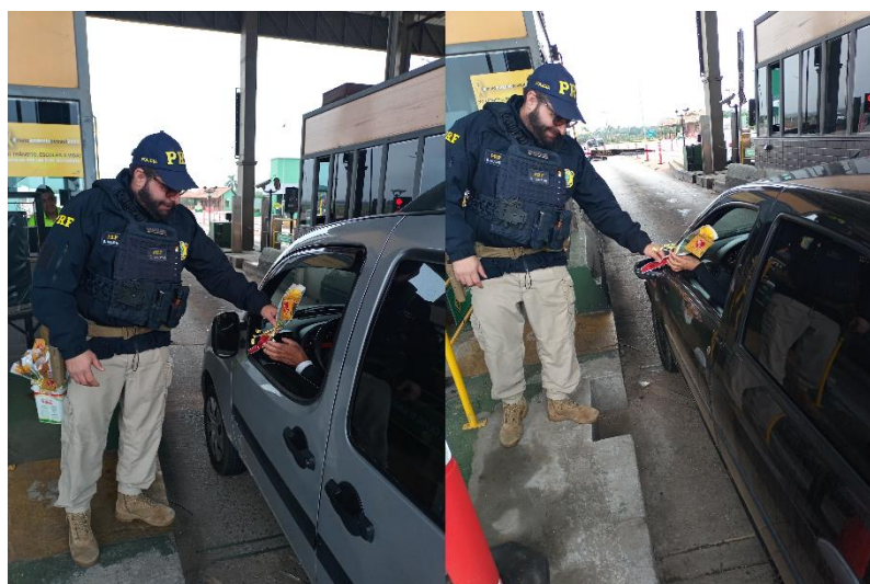
Figura 59 - Distribuição de flores pela PRF