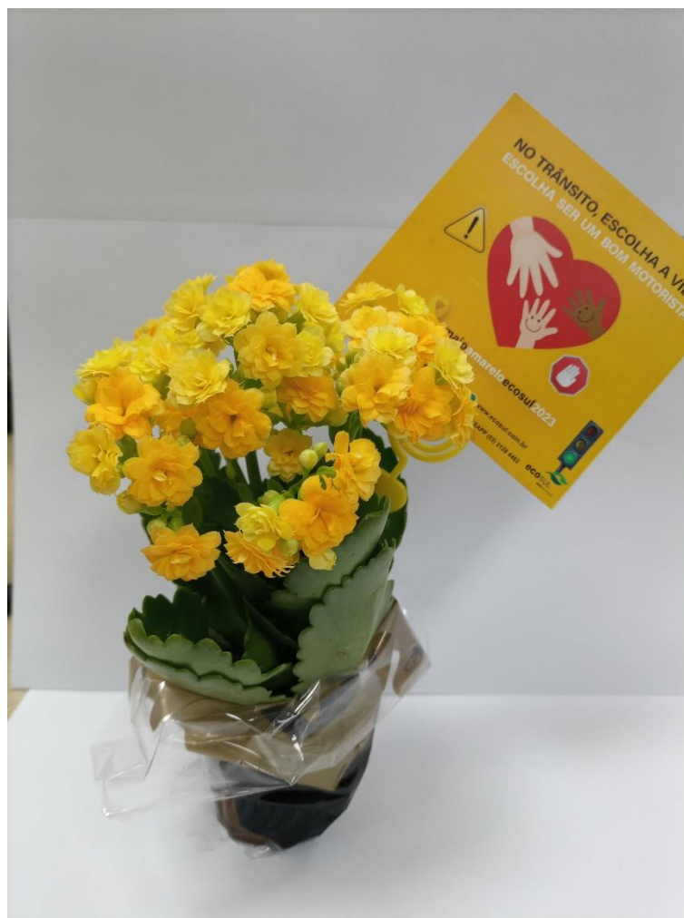
Figura 41 - Flor distribuída