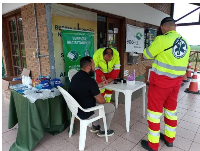
Figura 18 - Verificação de pressão e glicose

Ação Operação Verão realizada no dia 13 de janeiro de 2023 no SAL Cristal, BR-116/RS km 430, com atendimento a 85 pessoas.