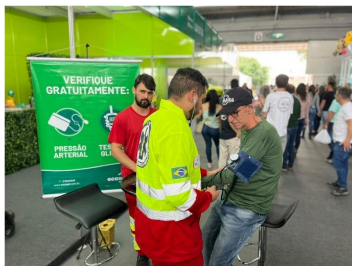
Figura 9 - Saúde na Feira - Estande Ecosul na Fenadoce