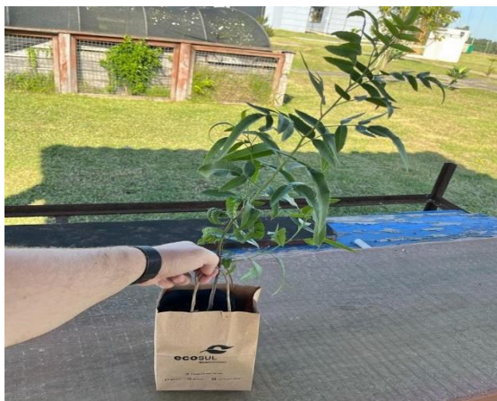
Figura 12 - Preparação de mudas para Fenadoce

Espaço Cultivar, projeto localizado na Sede administrativa. No total foram doadas 150 mudas, entre elas pitanga e aroeira.