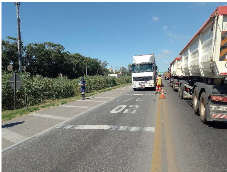
Figura 24 - Panfletagem realizada pela equipe da Rumo