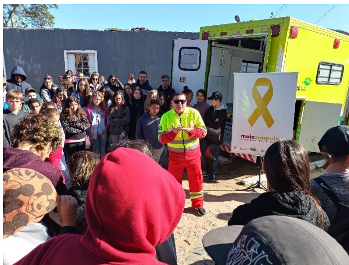
Figura 56 - Conversa sobre Primeiros Socorros