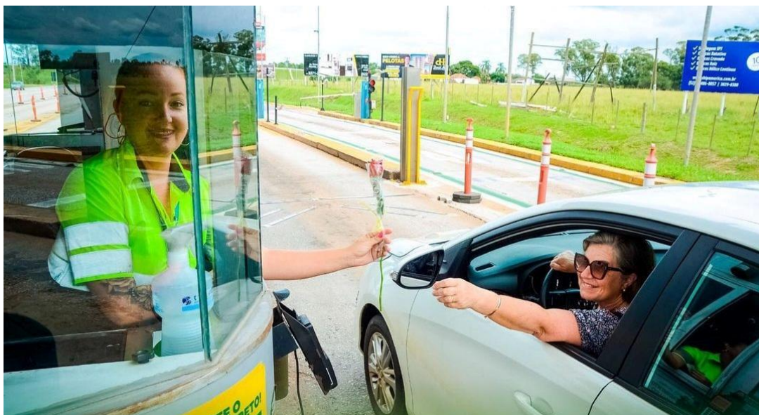
Figura 2 - Ação de homenagem às mulheres

No dia 09 de março de 2023, a concessionária distribuiu cerca de 1 mil rosas para mulheres que passaram pelas praças de pedágio do Capão Seco (sentido Santana da Boa Vista), Glória (sentido Rio Grande), Pavão (sentido Pelotas), Retiro (sentido Pelotas) e Cristal (sentido Camaquã). A ação objetivou homenagear usuários em celebração do “Dia Internacional da Mulher”.