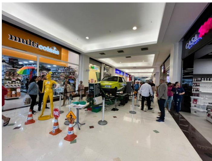
Figura 53 - Atividade com o simulador de capotamento