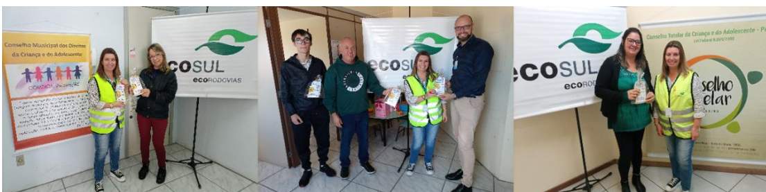
Figura 66 - Distribuição de material alusivo à data