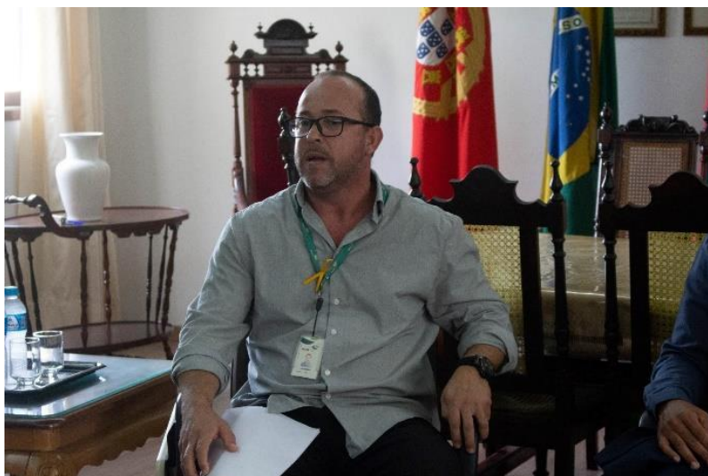
Figura 48 - Conversa sobre segurança no trânsito