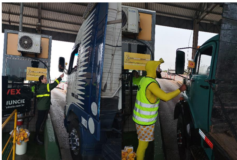
Figura 60 - Distribuição de flores