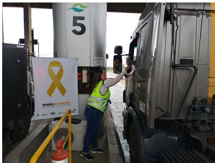
Figura 44 - Distribuição de flores