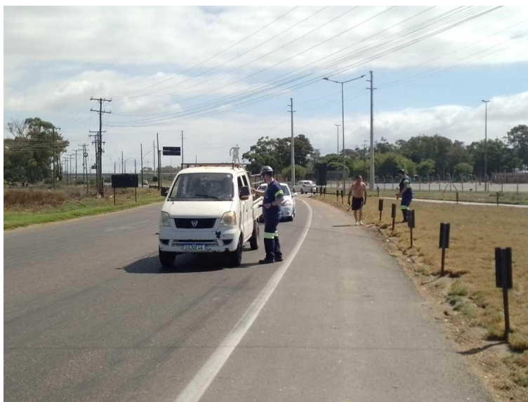
Figura 23 - Panfletagem realizada pela equipe da Rumo

Com o intuito de alertar sobre os riscos de abalroamentos nas vias férreas, a concessionária de ferrovias Rumo montou material educativo para sensibilizar os usuários quanto a passagem nas intersecções da via férrea. A Polícia Rodoviária Federal e a Ecosul participaram como apoiadores, sinalização e canalização do tráfego. A ação foi realizada no dia 24 de janeiro de 2023 na rodovia BR-392/RS km 8,90, em Rio Grande/RS, como mostrado nas figuras 23 e 24.