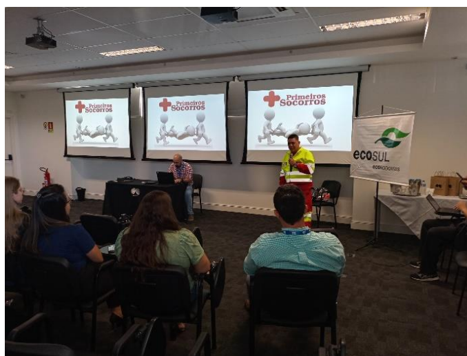
Figura 26 - Apresentação de palestra de Primeiros Socorros