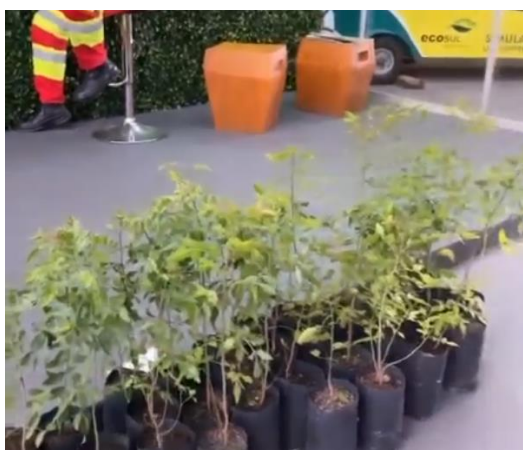
Figura 13 - Doação de mudas na Fenadoce