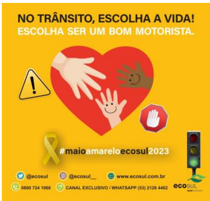
Figura 40 - Logo da campanha