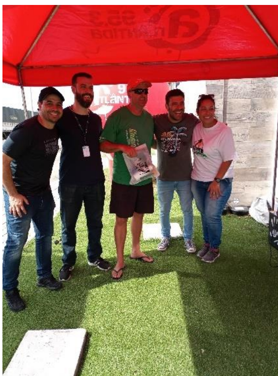
Figura 32 - Entrega de brindes a ouvintes