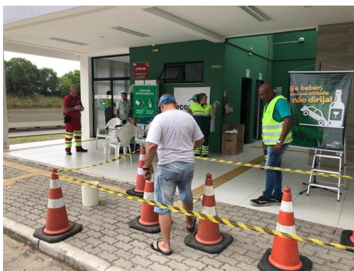
Figura 20 - Ação SAU Arroio Grande

Ação Operação Verão realizada no dia 27 de janeiro de 2023 no SAU Arroio Grande, BR-116/RS km 607, com atendimento a 25 pessoas.