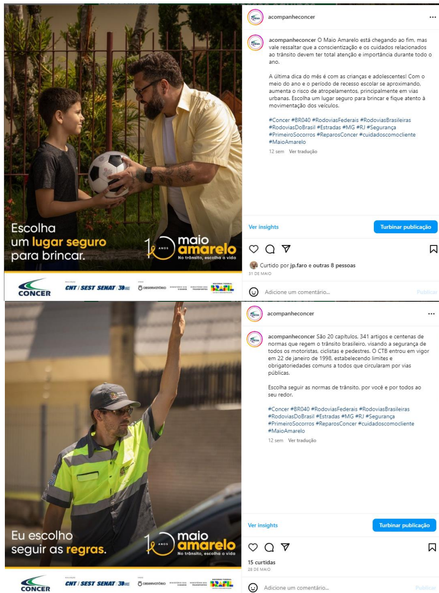
Figura 2: Postagem de Ação sobre Maio Amarelo, no Facebook, no Instagram @acompanheconcer e whatsapp. agosto de 2023.