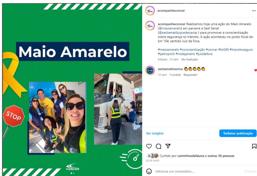
Figura 1: Postagem de Ação sobre conscientização de segurança no trânsito, no Facebook, no Instagram @acompanheconcer e whatsapp. Arquivo próprio, agosto de 2023.

A Concer em parceria com o Sest/Senat, em Duque de Caxias, realizou uma ação para promover a conscientização e chamar a atenção da sociedade para o alto índice de mortes e feridos no trânsito colocando em pauta o tema segurança viária. A ação aconteceu no posto fiscal do km 104, sentido Juiz de Fora.