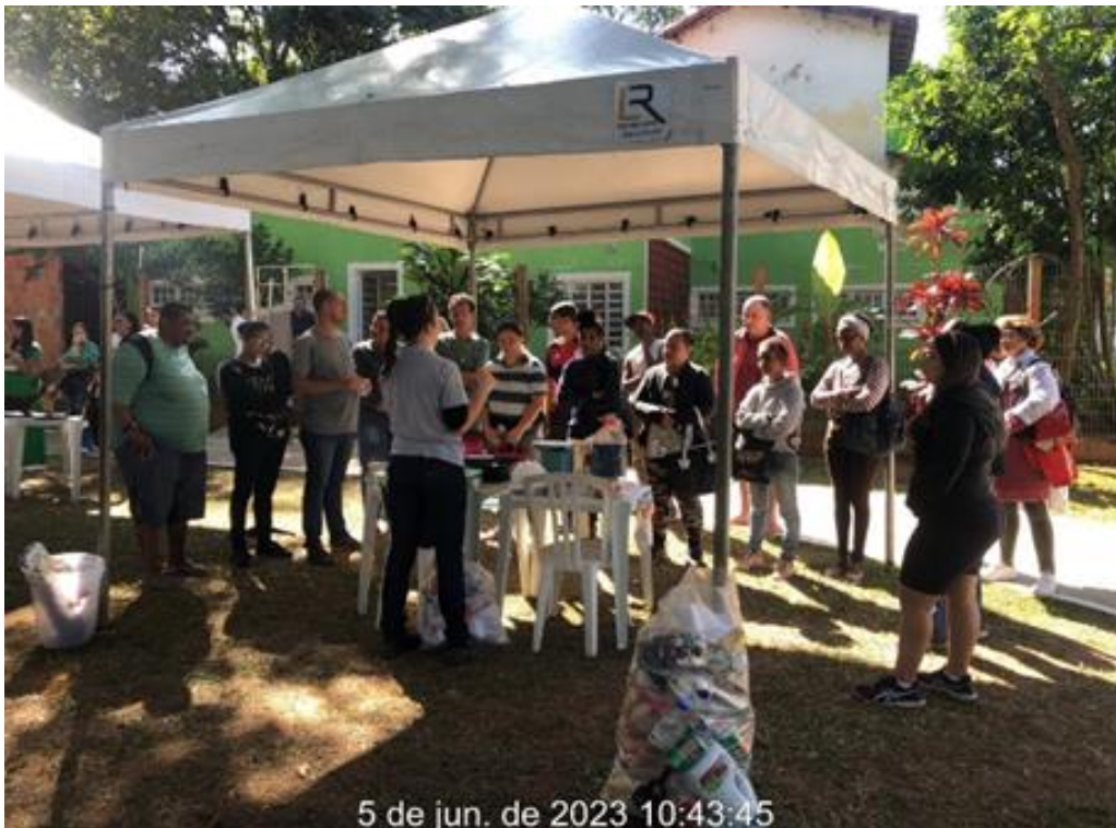
Figura 7: Realização de atividades na semana do Meio Ambiente com escolas municipais de Três Rios.

Social do município de Três Rios, levando atenção a temas ambientais. Foram montadas tendas diversas no tema ambiental/sustentabilidade e a Concer ficou responsável pelas tendas de coleta seletiva (crianças aprenderam a destinação correta dos resíduos de forma expositiva e interativa, por meio de dinâmica) e animais taxidermizados (exposição). As crianças/jovens participantes tinham liberdade de ir rotacionando entre os estandes.