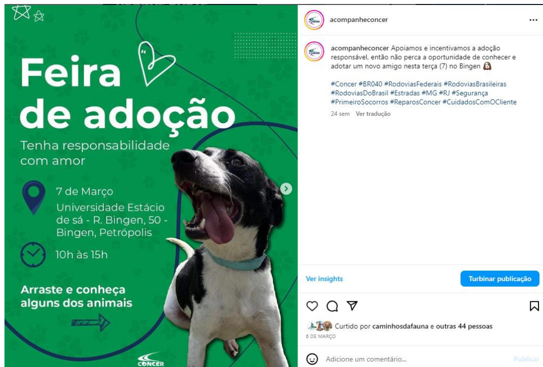
Figura 5: Postagem realizada no @acompanheconcer, dia 06/03/2023, para divulgação da feira de adoção em Petrópolis na Universidade Estácio de Sá. Arquivo próprio, fevereiro 2023.