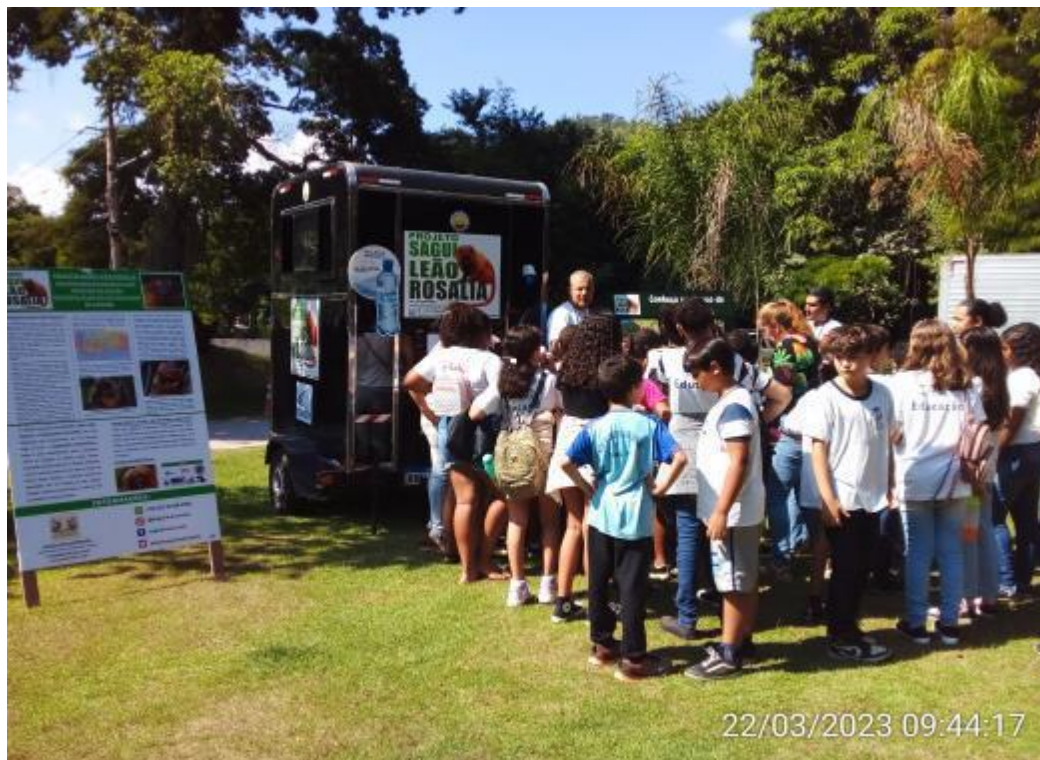
Figura 8: Realização de atividade do dia da água no município de Areal com os estudantes de escolas públicas. Arquivo próprio, agosto de 2023.

No mês de março a concessionária implementou na sede administrativa e na base da conservação a destinação do resíduo orgânico produzido pelos trabalhadores para o processo de compostagem, além do material oriundo da atividade de roçada da BR040. Com isto, através da equipe de meio ambiente, entre os meses de março e junho foram realizadas palestras educativas para esclarecimentos da importância da iniciativa, exposição de resultados, conscientização dos colaboradores sobre a importância da destinação correta dos resíduos, esclarecimento sobre o processo do ciclo orgânico (compostagem).