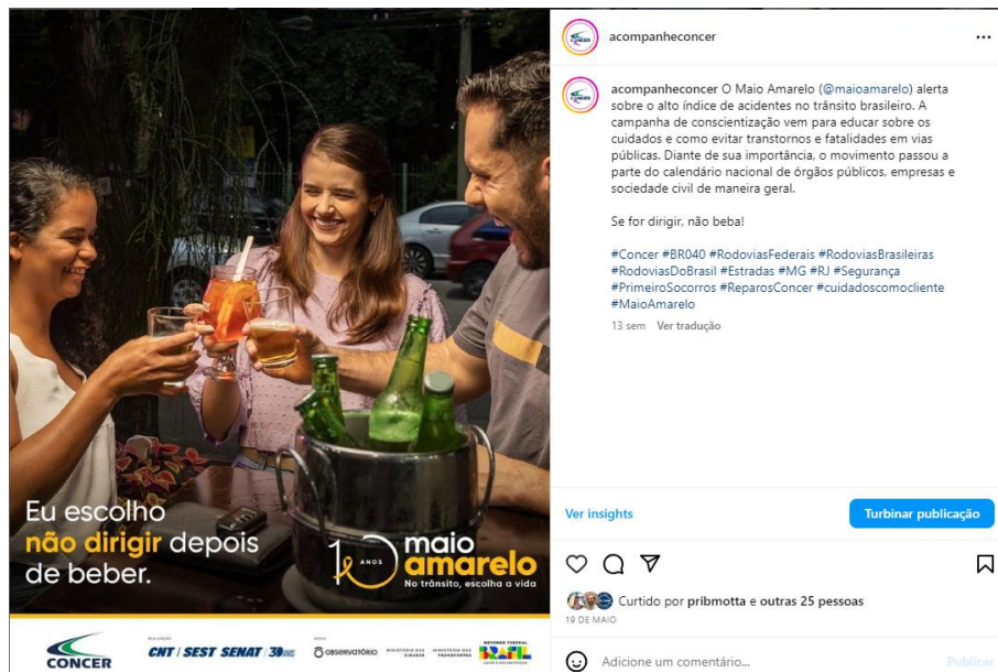
Figura 3: Postagem sobre conscientização de segurança no trânsito, no Facebook, no Instagram @acompanheconcer e whatsapp. Arquivo próprio, agosto de 2023.