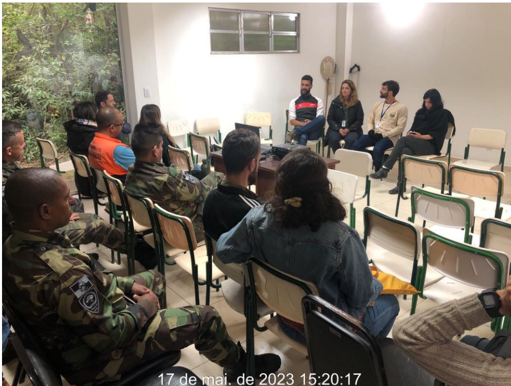
Figura 6: Realização de palestra através da equipe de meio ambiente da Concer em comemoração à Semana da Fauna. Arquivo próprio, agosto de 2023.

Além da atividade anteriormente mencionada junto aos stakeholders a Concer também realizou um evento junto ao INEA no mês de maio em homenagem à semana da Fauna. O intuito foi de trocar experiências de órgãos dentro e fora da região serrana do Rio, capacitando os profissionais da região para atuarem em diversos temas, como: contenção e soltura de animais, situações de emergência e catástrofes, entre outros.