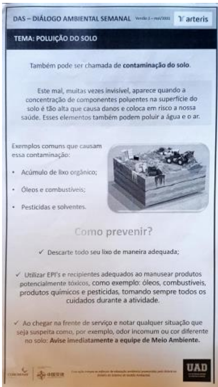
Figura 7 - Material didático do DAS, tema: Poluição do solo, realizado no dia 28/12, com a equipe de pavimento.