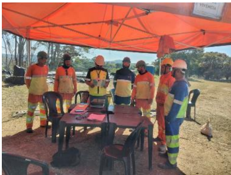
Figura 19 - Multiplicação do conhecimento sobre as Regras de Ouro de Meio Ambiente, Importância do Kit de Mitigação, FISPQ e Coleta Seletiva aos colaboradores de empresa terceirizada para execução de obra, KTS. (Projeto Embaixador do Meio Ambiente, arquivo próprio em agosto de 2023).