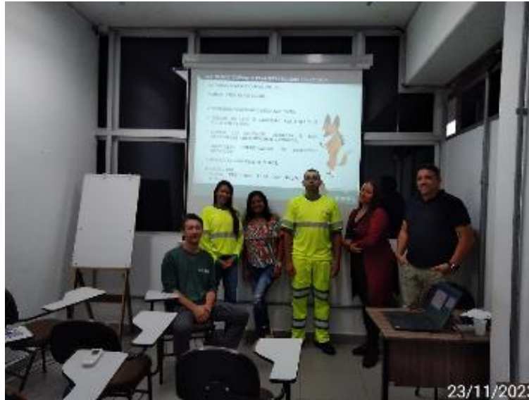
Figura 13 - Integração de meio ambiente ministrada à empresa terceira, realizada em 23/11/2023 – Praça 1 Sul Mairiporã / SP, no km 066+600.