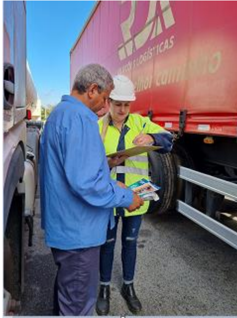
Figura 24 - Preenchimento das informações do veículo, orientação sobre manutenção dos veículos e segurança viária realizada pela equipe da concessionária (Operação Serra Segura, Base da PRF em Itapeva/MG, arquivo próprio em 17 agosto de 2023).