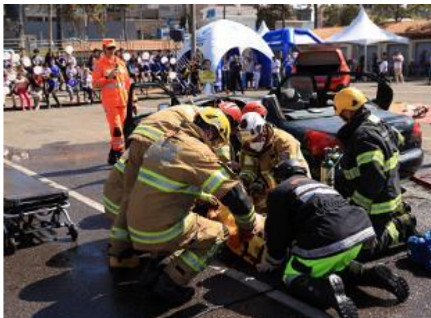
Figura 37 - Simulado de resgate à vítima de acidente (Simulado de resgate à vítima de acidente – Pátio da Rodoviária em Pouso Alegre/MG, arquivo próprio em setembro de 2023).