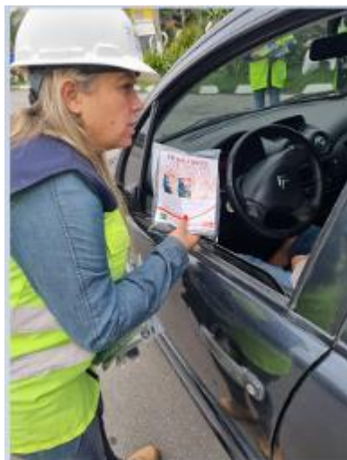
Figura 23 - Distribuição kit de higiene e orientação sobre o uso do cinto (Tô de Cinto, Tô Seguro, Km 47 Sul Base da PRF em Atibaia/SP, arquivo próprio em 28 setembro de 2023).