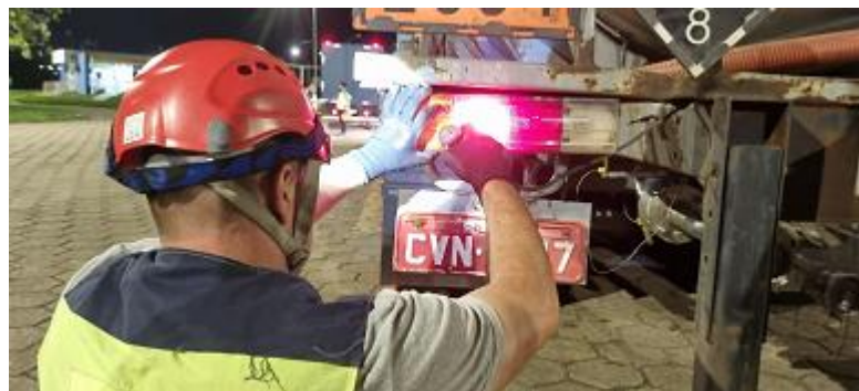
Figura 30 - Realização de manutenção elétrica (Programa Acorda Motorista, Km 844 Norte – Balança de Pesagem de São Sebastião da Bela Vista/MG, arquivo próprio em 10 de outubro de 2023).