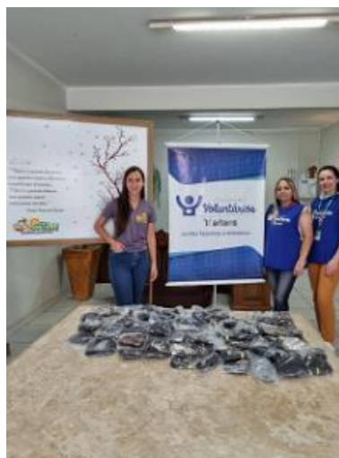
Figura 32 - Ação solidária voluntários Fernão Dias e externos – “Mechas do Bem” (Programa Voluntários, Associação São Rafael de Pouso Alegre/MG, arquivo próprio em outubro de 2023).