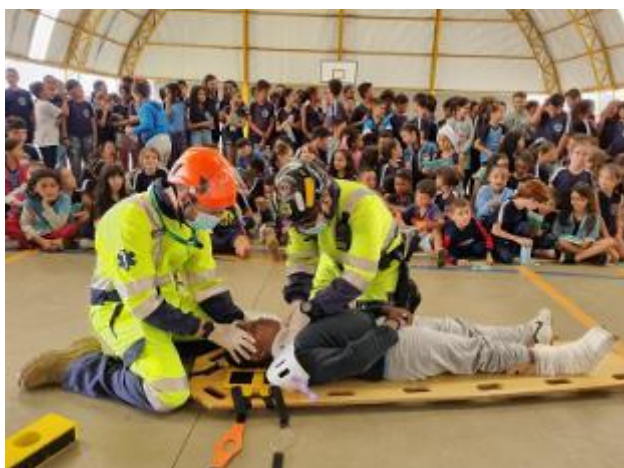
Figura 38 - Visita Externa (Simulação de APH na E.M. Jandyra Tosta de Pouso Alegre/MG, arquivo próprio em setembro de 2023).