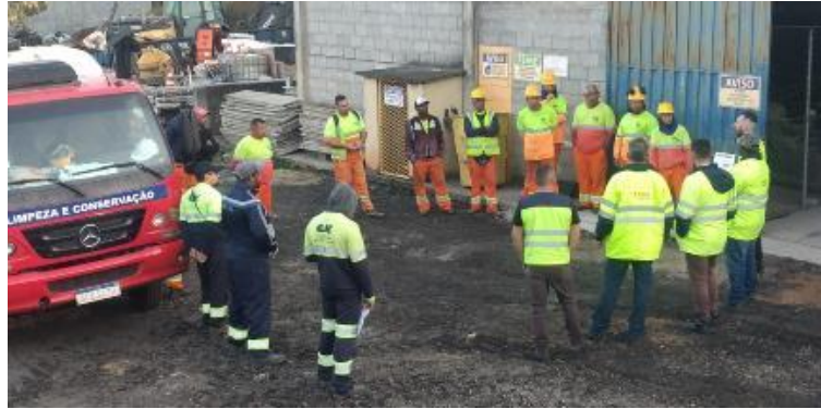
Figura 8 - DAS ministrado para a equipe de campo de limpeza e conserva, cujo tema foi Poluição do solo, ocorrido em 28/07/2023.