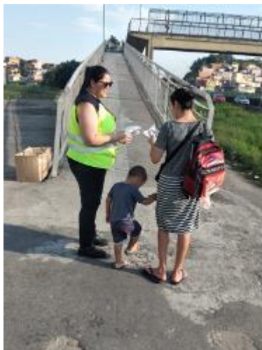
Figura 26 - Entrega de folder educativo com dicas de uma travessia segura e correta (Viva Pedestre e Viva Passarela, km 82+950 Norte – Guarulhos/SP, arquivo próprio em 19 setembro de 2023).