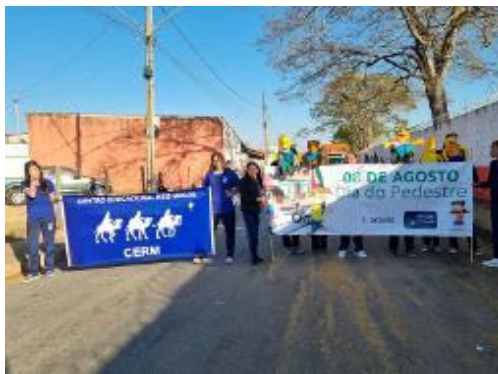
Figura 35 - Dia do Pedestre (Dia do Pedestre no Centro Educacional Reis Magos, arquivo próprio em agosto de 2023).