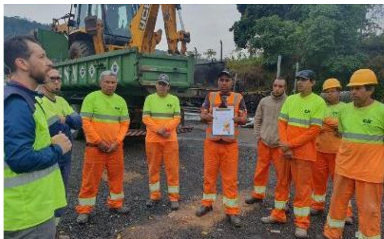
Figura 4 - DAS realizado para a equipe de campo, em 05/10/2023 (Arquivo próprio em outubro de 2023).