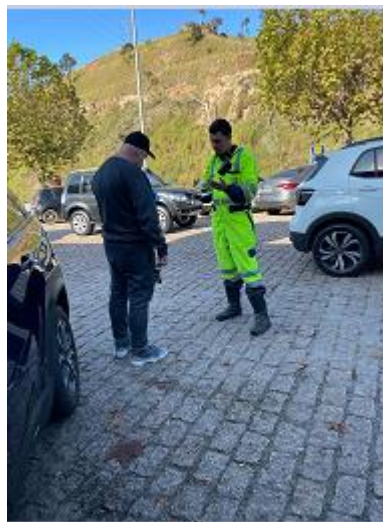
Figura 22 - Entrega de folder educativo e orientação sobre o uso do cinto (Tô de Cinto, Tô Seguro, km 62 Graal - Mairiporã/SP, arquivo próprio em 07 setembro de 2023).