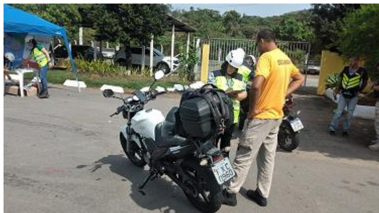
Figura 29 - Preenchimento formulário com os dados da moto (Programa Viva Motociclista, Km 47 Sul - Base da PRF em Atibaia/SP, arquivo próprio em 26 setembro de 2023).