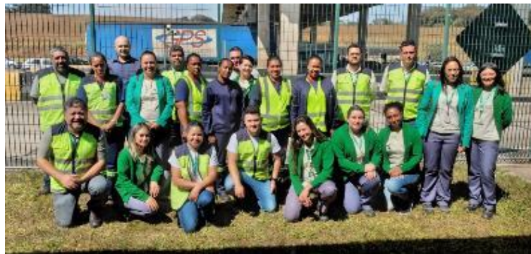
Figura 3 - Treinamento ministrado para a Praça 05 de pedágio, realizado no dia 08/08/2023, cujo tema foi PBA – Plano básico ambiental.