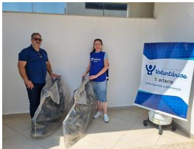
Figura 33 - Doação de cadeiras de rodas (Programa Lacre Amigo, Arquidiocese de Pouso Alegre – Paróquia da Sagrada Família de Pouso Alegre/MG, arquivo próprio em outubro de 2023).