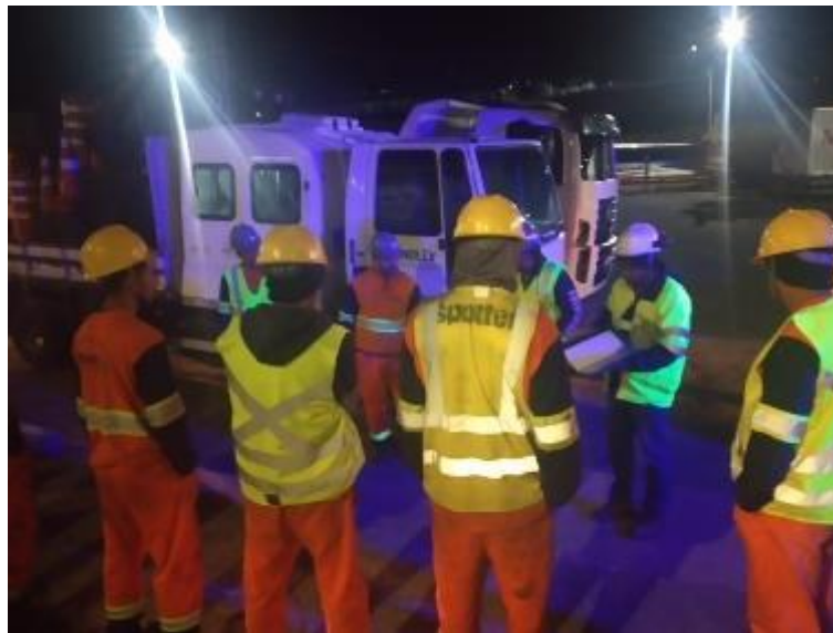
Figura 18 - Multiplicação do conhecimento sobre as Regras de Ouro de Meio Ambiente, Importância do Kit de Mitigação, FISPQ e Coleta Seletiva aos colaboradores de empresa terceirizada para execução de obra, NUNOLEV. (Projeto Embaixador do Meio Ambiente, arquivo próprio em agosto de 2023).