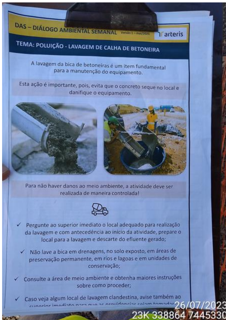
Figura 5 - Material didático do DAS, tema: Poluição – Lavagem de calha de betoneira, realizado no dia 26/07 nas frentes de serviços.