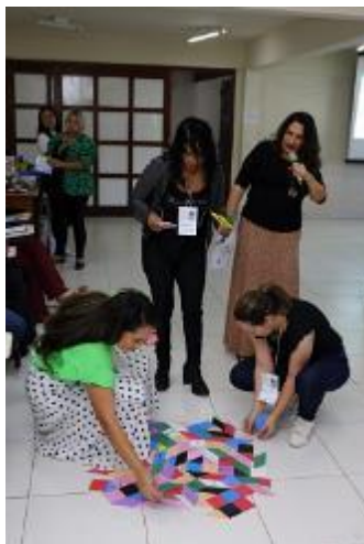
Figura 36 - Reunião Pedagógica (Reunião Pedagógica Presencial em Igarapé/MG, arquivo próprio em agosto de 2023).