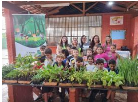
Figura 34 - Entrega das mudas de hortaliças (Doação Mudas, E. M. Marciano Ferraz de São Gonçalo do Sapucaí/MG, arquivo próprio em outubro de 2023).