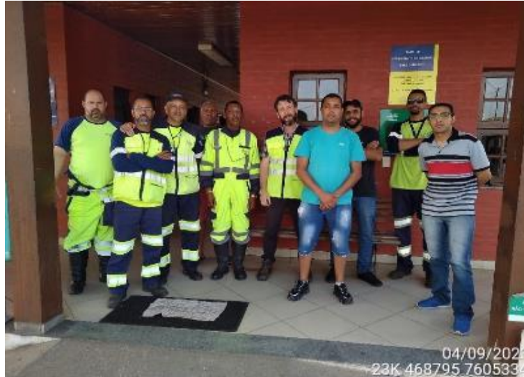
Figura 2 - Treinamento ministrado pela supervisão ambiental da Concremat aos colaboradores da Arteris e BR Vida, ocorrido em 04/09/2023, cujo tema abordado foi fauna na rodovia, realizado na BSO 6 no município de Três Corações / MG.