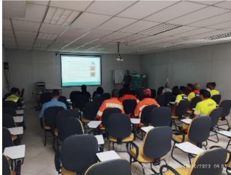
Figura 15 - Integração de meio ambiente ministrada à empresa terceira, realizada em 10/10/2023 - Sede de Pouso Alegre/MG, no km 850+500.