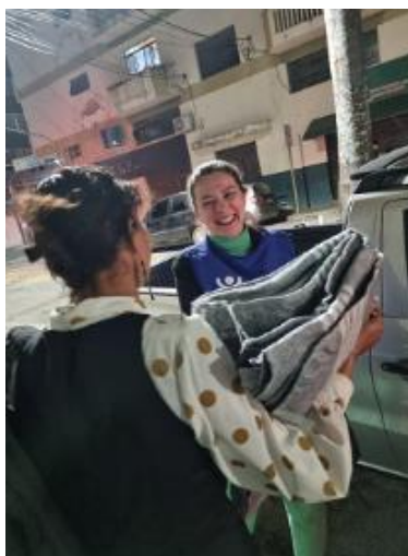
Figura 31 - Ação solidária voluntários Sede – “Com Amor, Doe um Cobertor e Aqueça o seu Coração” (Programa Voluntários, CEMAPA: Centro Municipal de Acolhimento Provisório para Adultos, arquivo próprio em julho de 2023).