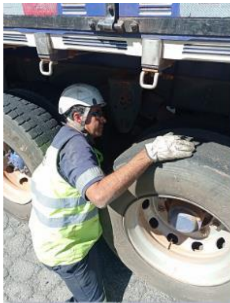
Figura 25 - Verificação dos componentes mecânicos do veículo realizada pela equipe da concessionária (Operação Serra Segura, Km 08 Norte - Base da PRF em Vargem/SP, arquivo próprio em 04 setembro de 2023).