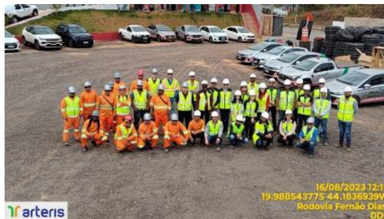
Figura 1 – Diálogo Ambiental Semanal - DAS ministrado pela Concremat aos colaboradores das empresas Neovia e Arteris, ocorrido em 16/08/2023, com o tema Aspectos e Impactos ambientais, realizado na frente de obra da Neovia, em Vargem/SP, no km 000+007.