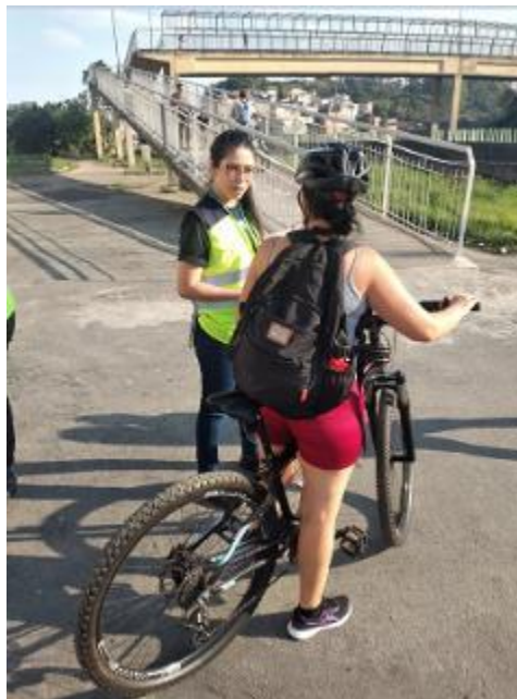
Figura 27 - Entrega de folder educativo e orientação sobre uma travessia correta e segura (Programa Viva Ciclista, km 82+950 Norte – Guarulhos/SP, arquivo próprio em 19 setembro de 2023).