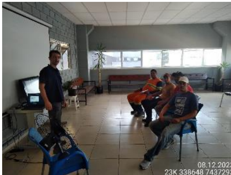
Figura 14 - Integração de meio ambiente ministrada à empresa terceira, realizada em 08/12/2023 – Escritório de Atibaia/SP, no km 44.5.