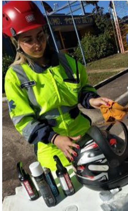
Figura 28 - Higienização de capacete (Programa Viva Motociclista, Km 499 Norte - Base da PRF em Betim/MG, arquivo próprio em 27 julho de 2023).