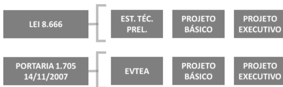
Figura 1: Etapas de projeto

Para a construção da metodologia e suas composições de custos unitários (CCUs) foram abordados vários normativos presentes em atenção à necessidade de ancorar a metodologia para alocação de recursos nas etapas evolutivas dos estudos e projetos de engenharia, em sinergia com a Lei de licitações, nº 8.666, e a Portaria Nº 1.705 de 14 de novembro de 2007 do DNIT. Assim, foram identificados os níveis de detalhamento de engenharia, para o desenvolvimento dos projetos, conforme a Figura 1.