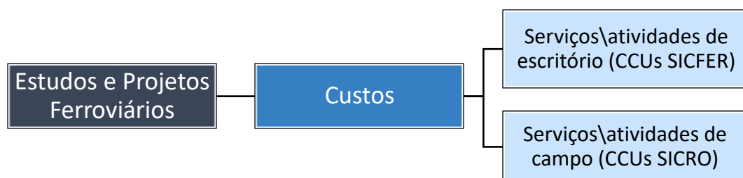
Figura 4: Composição dos Estudos e Projetos Ferroviários

A presente metodologia permite inferir as parcelas que formam os custos para cada projeto em função da sua natureza e características. Pode-se assim compilar essas parcelas em duas (02) grandes categorias: serviços e atividades de escritório e serviços e atividades de campo, conforme a Figura 4.