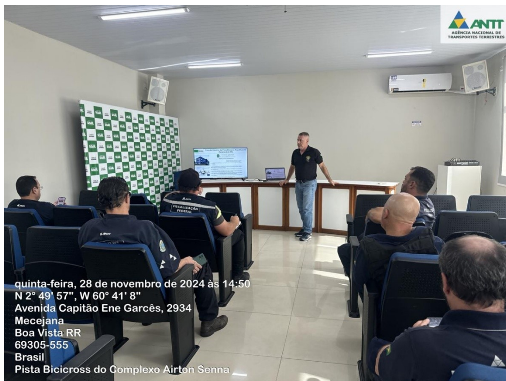
Figura 8 - Alinhamento com a CENSIPAM