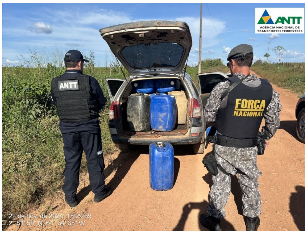
Figura 5 - Apreensão de combustível e encaminhamento à autoridade competente