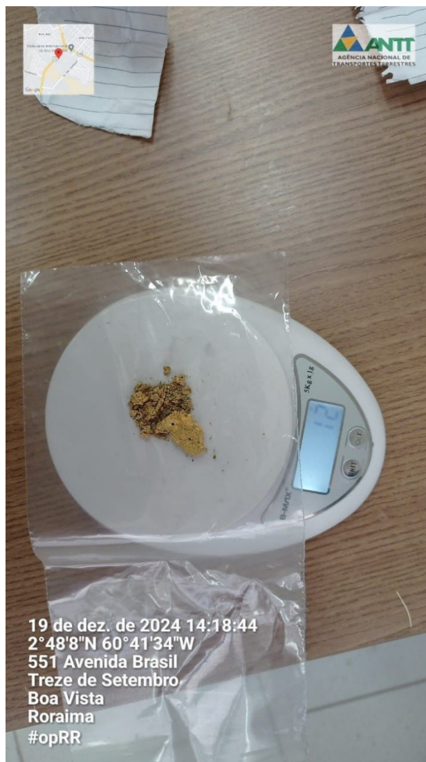
Figura 3 - Recolhimento de ouro ilegal para encaminhamento ao órgão competente (PF)