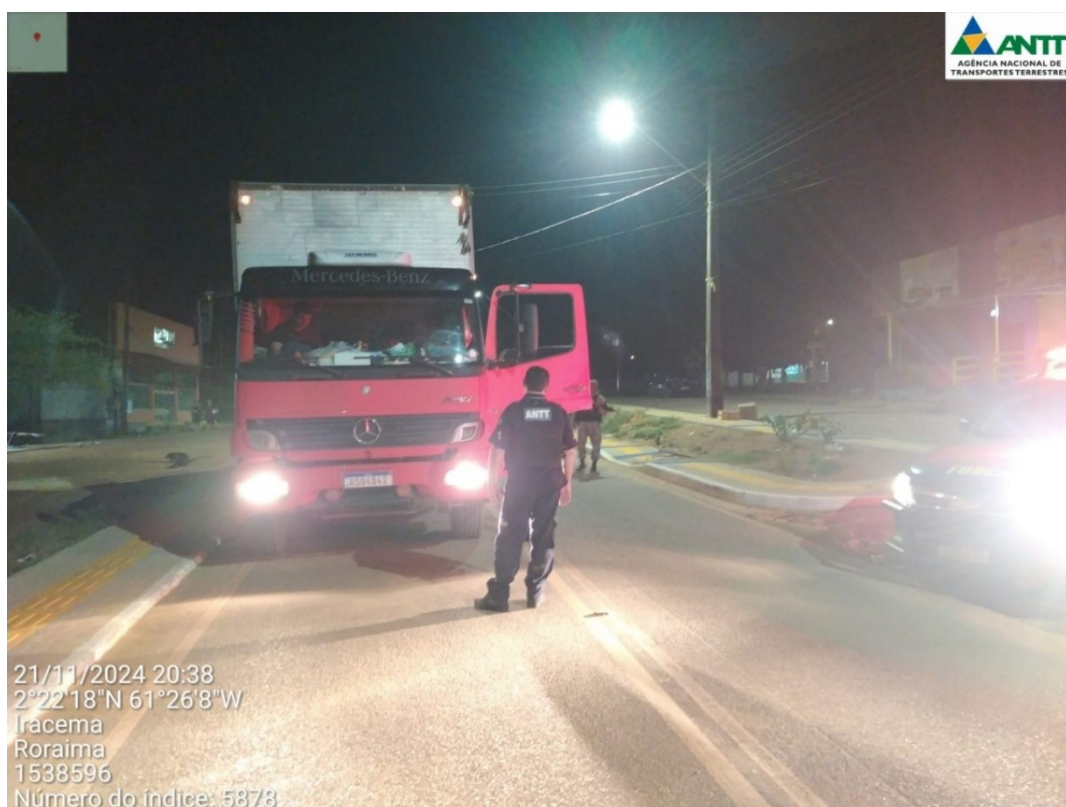
Figura 4 - Fiscalização Noturna