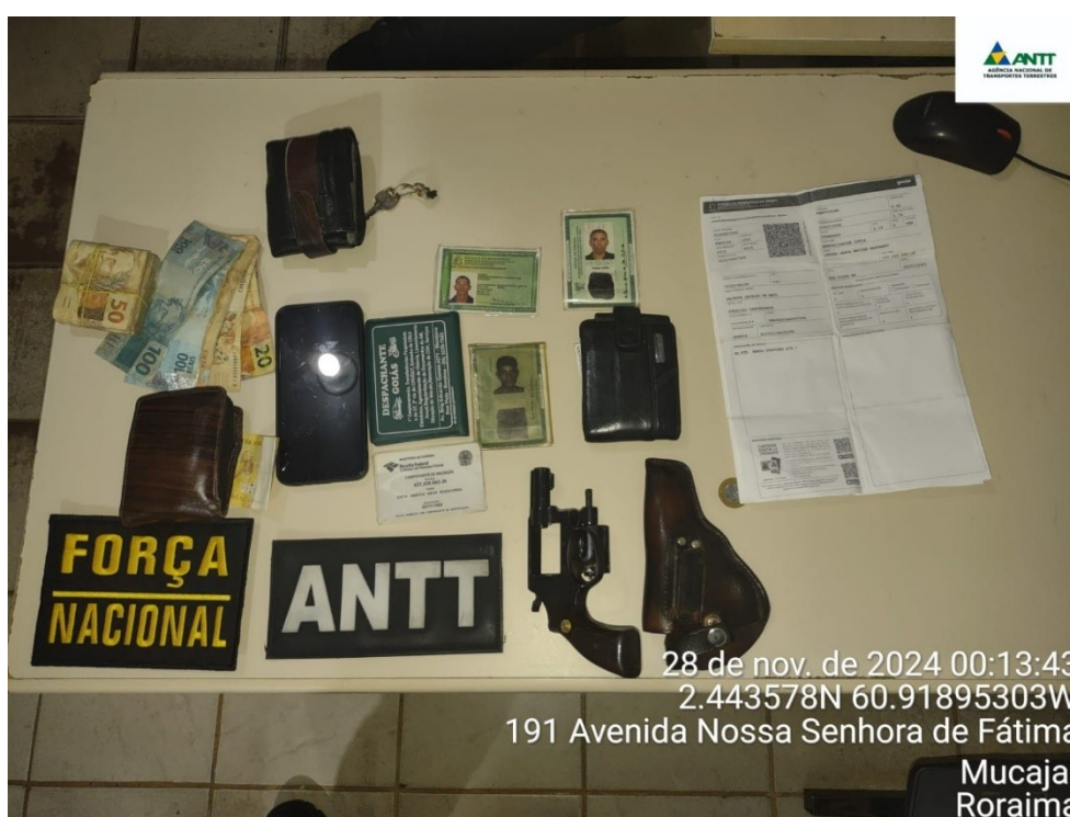
Figura 6 - Apreensão de armamento e encaminhamento ao órgão competente (PCRR)

4.3. Meta 2: Produção e Disponibilização de Dados de inteligência da Agência no enfrentamento da Crise Humanitária na Terra Indígena Yanomami.