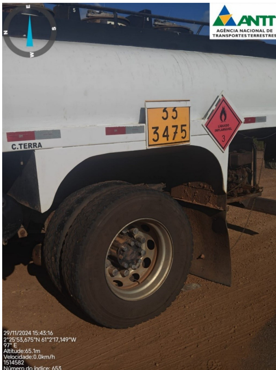
Figura 2 - Fiscalização de Transporte de Produtos Perigosos