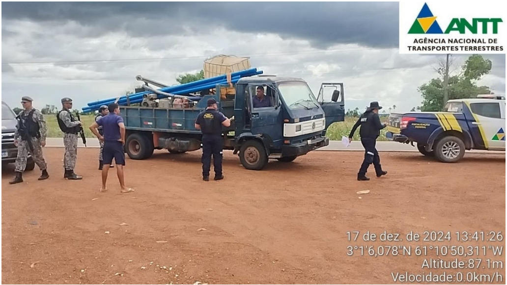
Figura 1 - Fiscalização de transporte de Cargas