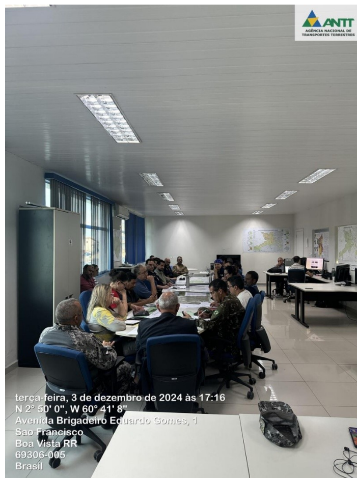
Figura 7 - Reunião do Pôr do Sol