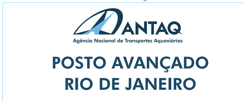
PLACA PARA FACHADA

Modelo 2 - Tamanho: 620 x 150mm de largura