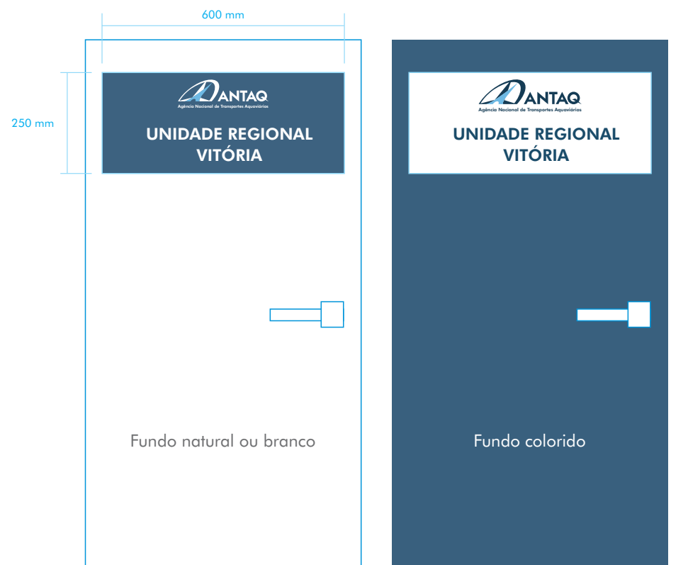
PLACA PARA PORTA