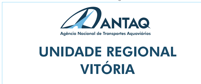
PLACA PARA FACHADA

Modelo 2 - Tamanho: 620 x 150mm de largura