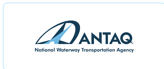
Versão Horizontal em inglês USO PREFERENCIAL