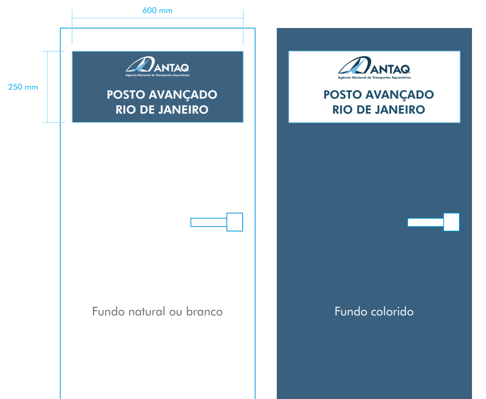
PLACA PARA PORTA