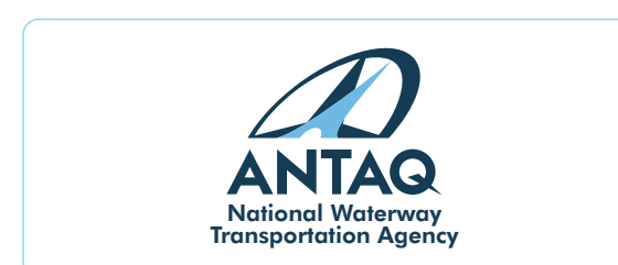
Versão Vertical em inglês