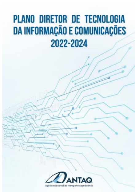
Figura 2 - Capa do Plano Diretor de Tecnologia da Informação e Comunicações 2022-2024.

Conforme descrito na introdução do Plano, o PDTIC é o instrumento de governança, gestão, monitoramento, demandas e aquisições de TIC. Possui o objetivo de buscar as necessidades informacionais para descrever e atender às necessidades de Tecnologia da Informação da ANTAQ.