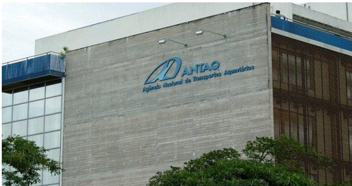
Figura 1 - Fachada da Agência Nacional de Transportes Aquaviários (ANTAQ).

O PDA está em sinergia com a estratégia da ANTAQ e instrumentos de gestão em nível tático da agência que viabilizam e potencializam as ações para divulgação e acesso a dados da Agência. Assim, faz-se necessário detalhar o alinhamento do PDA com o Plano Estratégico da ANTAQ, ciclo 2021-2024, Plano Diretor de Tecnologia da Informação e Comunicação (PDTIC), Política de Gestão de Riscos. No nível operacional, há necessidade do monitoramento das ações do PDA no Plano de Gestão Anual da ANTAQ.