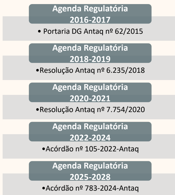
Figura 1 – Histórico das Agendas Regulatórias da Antaq.

Desde 2016, a Antaq já elaborou e disponibilizou à sociedade cinco Agendas Regulatórias: