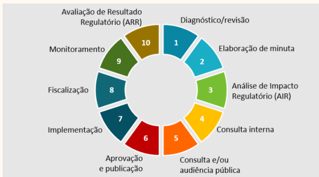
Figura 1 – Ilustração representando o Ciclo Regulatório.

de qualidade regulatória da Agência e como elemento essencial para a tomada de decisões regulatórias mais consistentes, transparentes e orientadas ao interesse público.