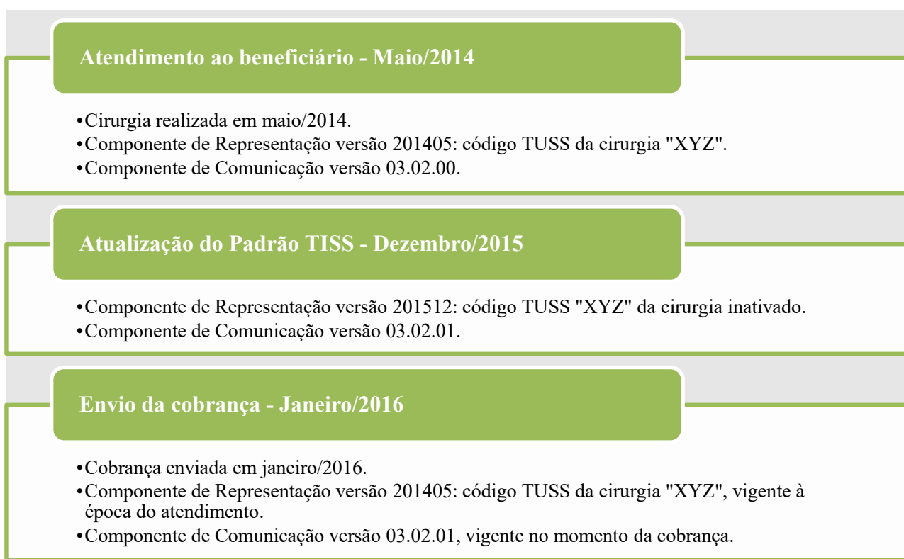
Figura 2 – Troca de informações em diferentes versões dos Componentes

210. O esquema abaixo ilustra a troca de informações em diferentes versões dos Componentes do Padrão TISS. Destacamos que as datas colocadas no esquema abaixo são apenas para exemplificar o processo: