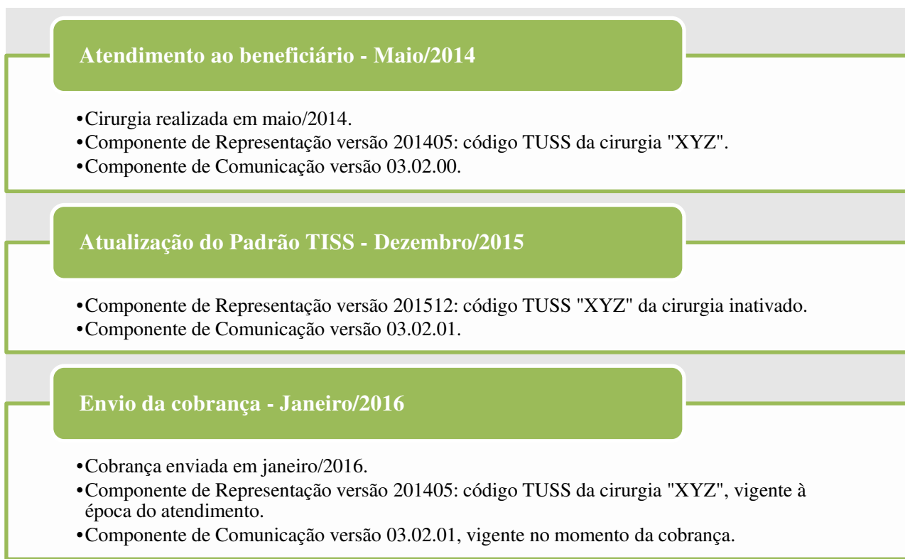
Figura 2 – Troca de informações em diferentes versões dos Componentes