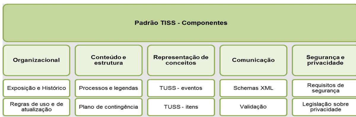
Figura 1 - Diagrama dos Componentes do Padrão TISS