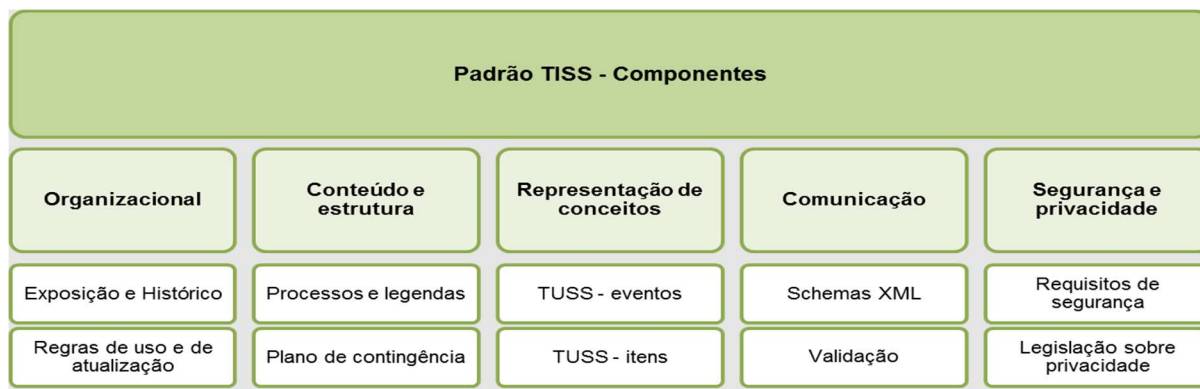
Figura 1 - Diagrama dos Componentes do Padrão TISS