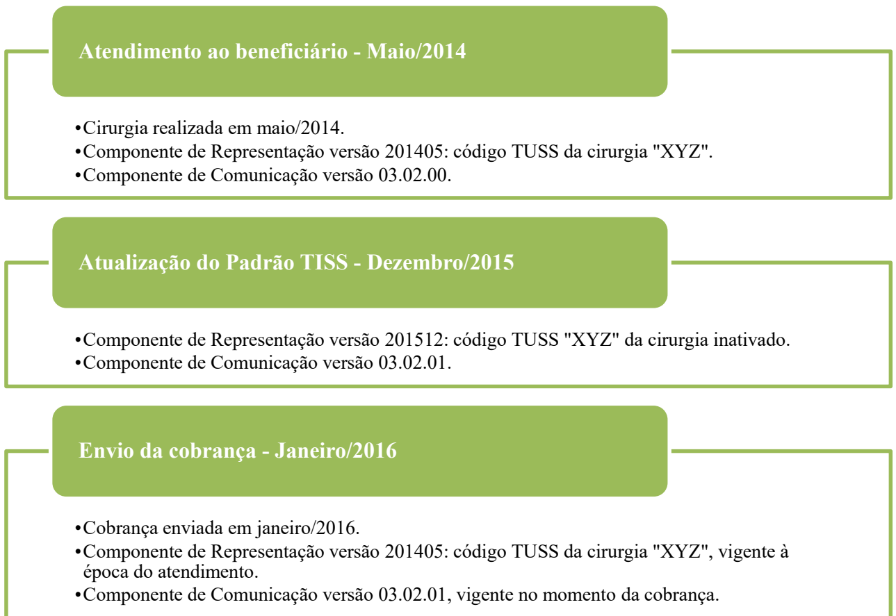
Figura 2 – Troca de informações em diferentes versões dos Componentes