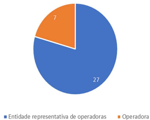
Contribuições por tipo de contribuinte