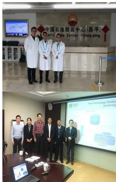
CPD (Centro de Processamento de Dados) da CNPC e apresentação da ANP para técnicos da CNPC/BGP.