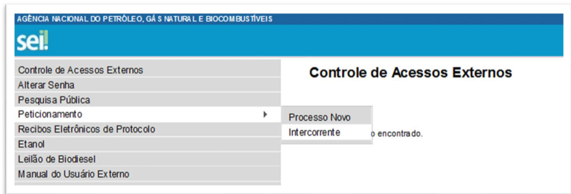
Figura 5 - Tela para petitionamento intercorrente

Após a seleção da opção “Petitionamento Intercorrente”, é necessário o preenchimento do formulário (Figura 6). Na seção “processo” inserir o número do processo no qual deseja petitionar a documentação adicional e clicar no botão “validar”. Depois que o processo for validado, clicar em “adicionar”.