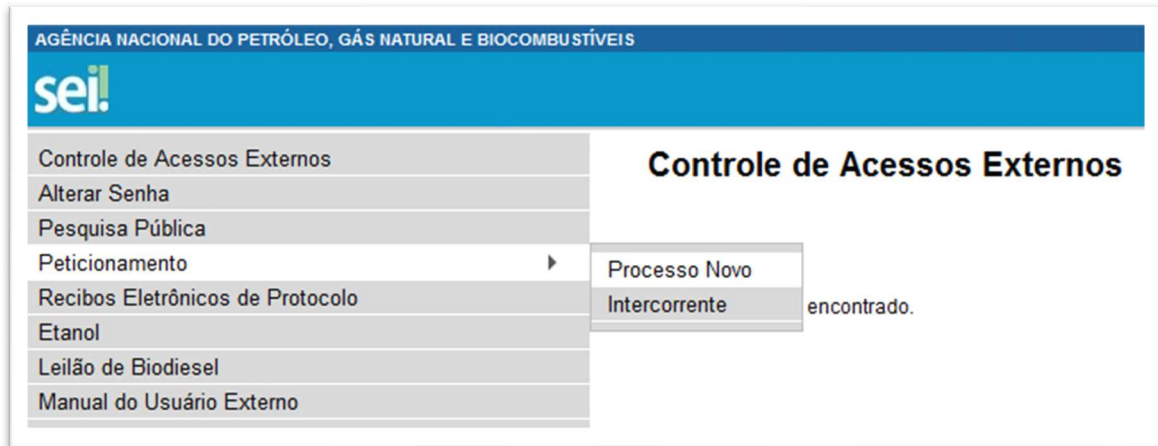
Figura 2 - Tela para petitionamento de novo processo

Para peticionar nova solicitação, o usuário deverá acessar no menu à esquerda, a opção “Petitionamento Eletrônico”, conforme Figura 2.