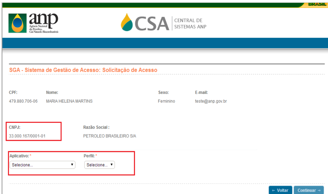
Figura 3 – Seleção de aplicativo e perfil de acesso.

Após informar o CPF e e-mail, o sistema solicita o número do CNPJ e a indicação do aplicativo e perfil desejados (Figura 3). O aplicativo a ser selecionado é i-Engine e o perfil de acesso é “SCP / Carga de Dados de Comercialização” (ENGINE_UPLOAD_SCP) .