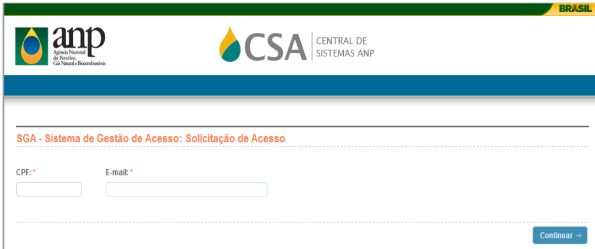
Figura 2 – Cadastro para solicitação de acesso.

Para solicitar o acesso, deve-se informar, primeiramente, o número do CPF e e-mail do usuário que o está solicitando (Figura 2).