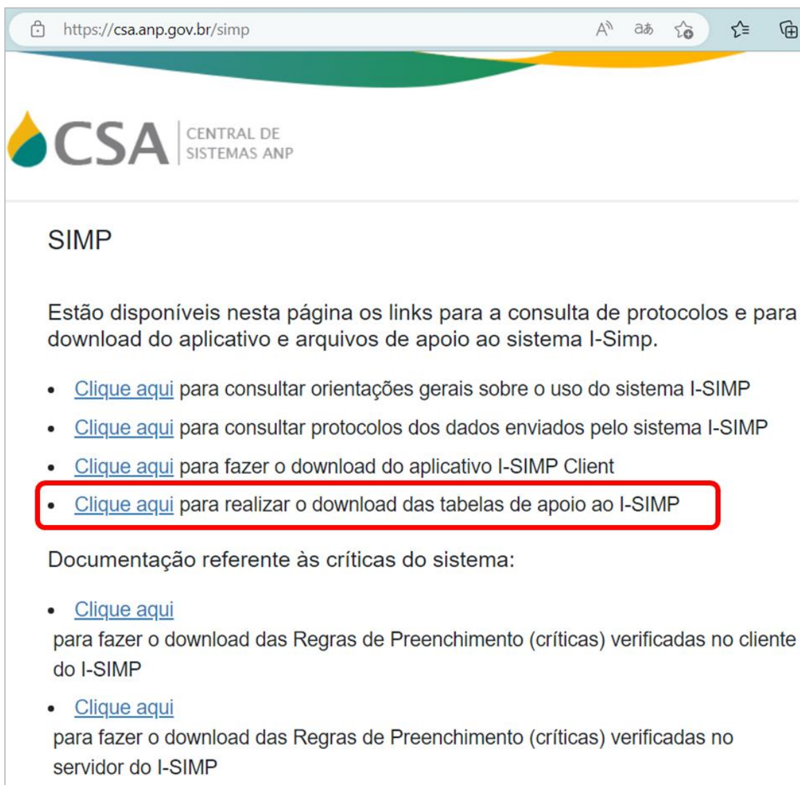
Figura 5 – Página para acesso ao Simp.

É possível obter as tabelas contendo os códigos i-Simp para todos estes campos acessando, o link ( https://csa.anp.gov.br/simp ), conforme apresentado na Figura 5.