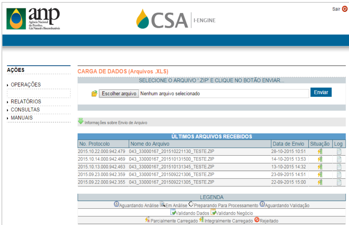
Figura 8 – Tela de carga do arquivo de comercialização

OBSERVAÇÃO: Todo arquivo carregado no i-Engine será objeto de análise quanto à sua estrutura e à sua formatação. O tempo de análise vai depender do número de linhas do arquivo. Recomendamos aguardar a conclusão do processamento e, posteriormente, verificar a SITUAÇÃO (STATUS) final da carga.