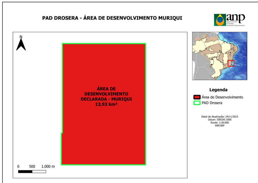
Mapa da 3rea retida do PAD Drosera (verde) e 3rea desenvolvimento de Muriqui (vermelho).