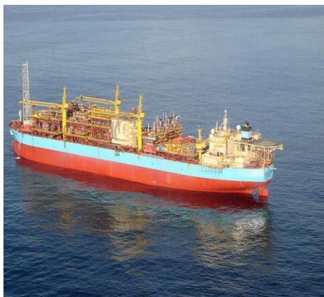
Foto: FPSO Peregrino