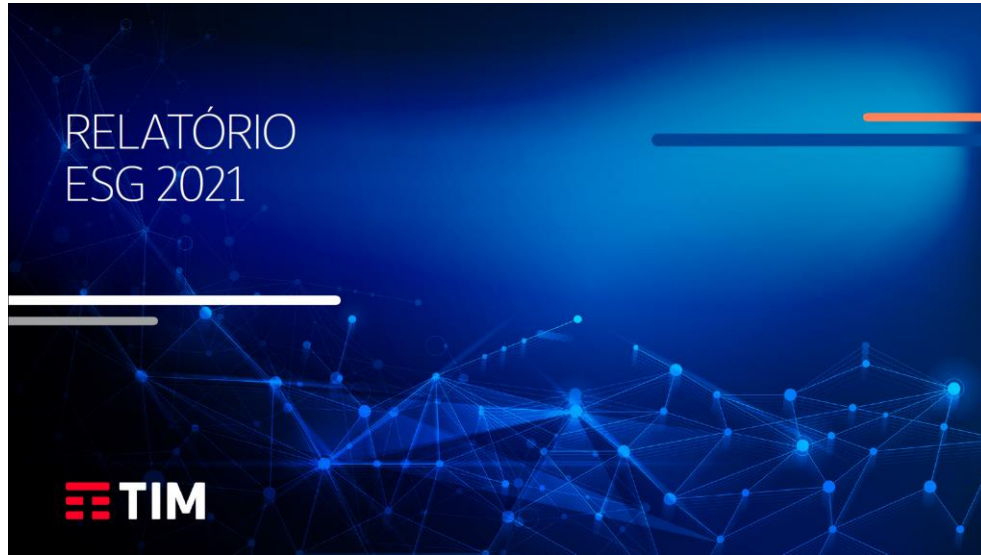
Relatório ESG - Publicado em linha com a TIM Italia (31/03)