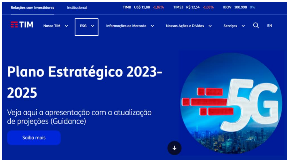
Site de Relações com Investidores – Página de ESG