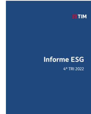
Informes ESG trimestrais