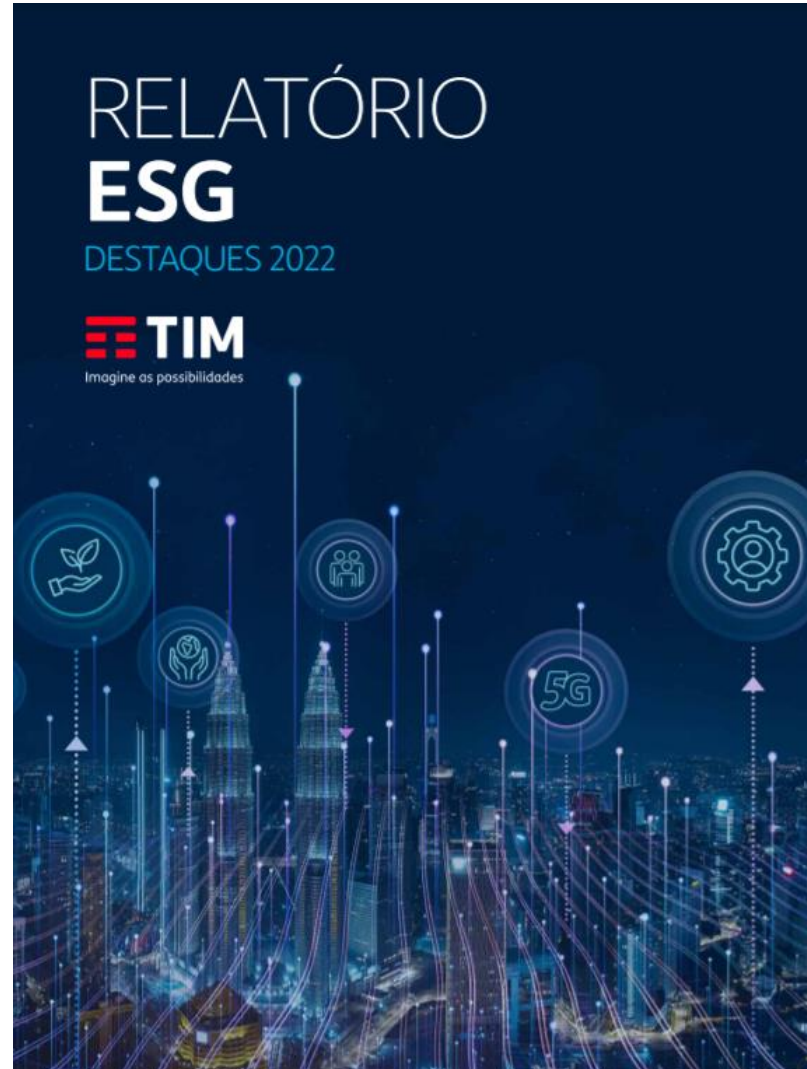
Relatório ESG resumido - Publicado junto às demonstrações financeiras (4T22), em fev/23