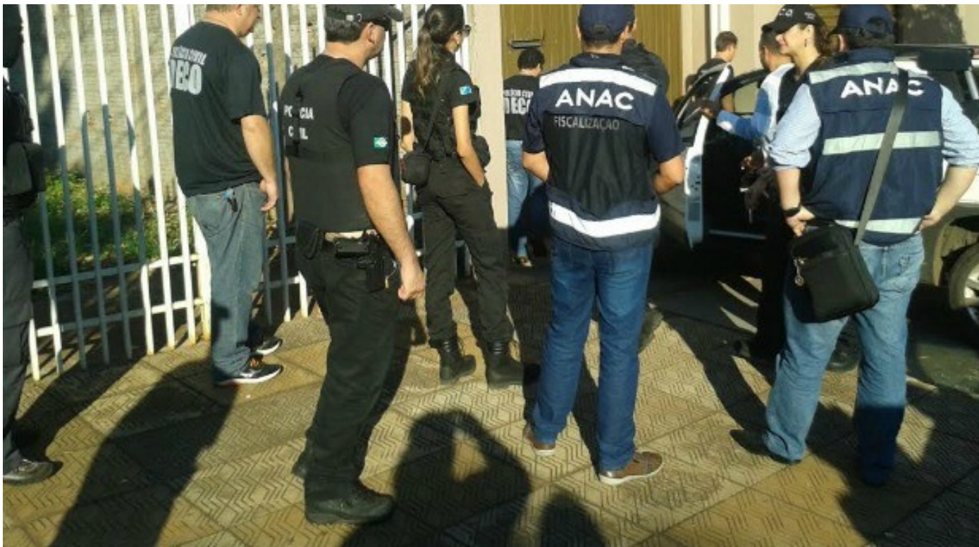
Policiais da Deco e fiscais da Anac em operação, em Campo Grande