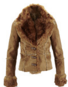
Jaqueta de pele falsa marrom