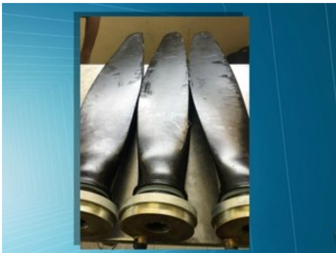
Hélices podem estar irregulares ou terem sido roubadas, diz polícia

Nas vistorias, a perícia ainda constatou que o avião interditado tinha sido comprado em leilão. Ele pertence a um pecuarista e, da plaqueta de identificação, ao motor e hélice, tudo havia sido alterado. A aeronave, no mês de junho de 2015, havia sofrido um acidente. “Ela caiu de nariz para o chão, ainda com o motor ligado. O proprietário não comunicou o acidente e ainda fez diversas alterações, por isso houve a interdição. Em seguida, a Anac suspendeu o Certificado de Aeronavegabilidade [CA] desta e de mais 45 aeronaves em todo o país”, disse Ana Claudia.