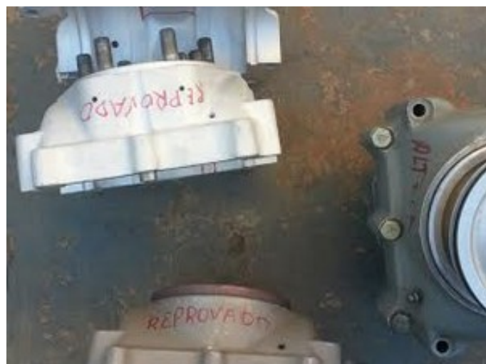
Peças vistoriadas durante ação policial