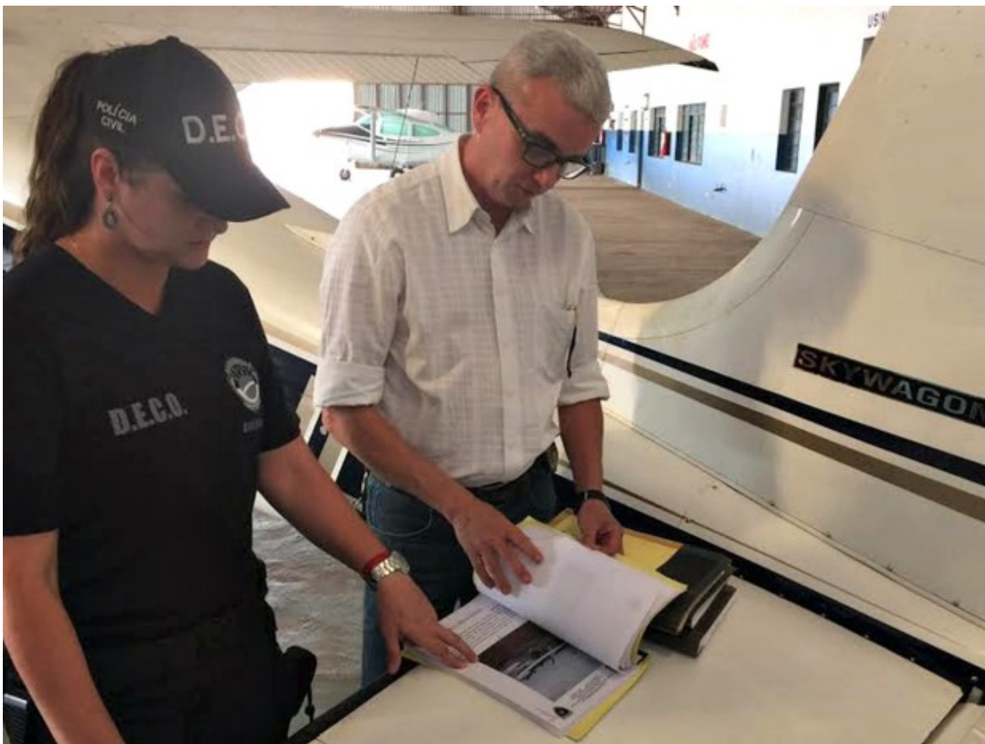
Aeronave foi apreendida e condenada após verificação da polícia e perito

desempenho. “Achamos casos em que quase 90% do avião estava estragado e fizeram o conserto em oficinas clandestinas. Ou então casos em que o dono leva em uma oficina homologada, mas, esta envia a peça para um conserto clandestino e depois entrega e assina algo legalmente”, complementou a delegada.