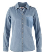
Camisa jeans azul manga longa