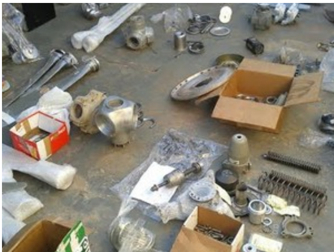
Peças apreendidas durante buscas em Campo Grande

desconhecido pela agência reguladora”, afirmou ao G1 o piloto.