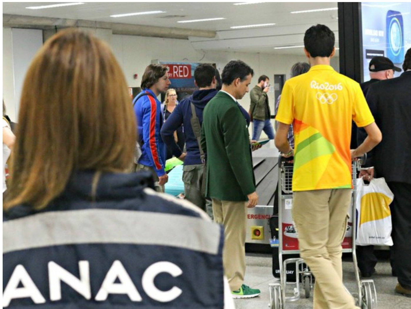
Fiscais da Agência durante os jogos olímpicos 2016

muito volume de passageiros, não só a agência, mas todo o setor de aviação teve que se organizar para que tudo ocorresse da melhor forma possível. Tivemos um sucesso muito grande e agora a responsabilidade é ainda maior", finalizou o gerente mineiro.