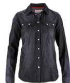
Camisa jeans preta manga