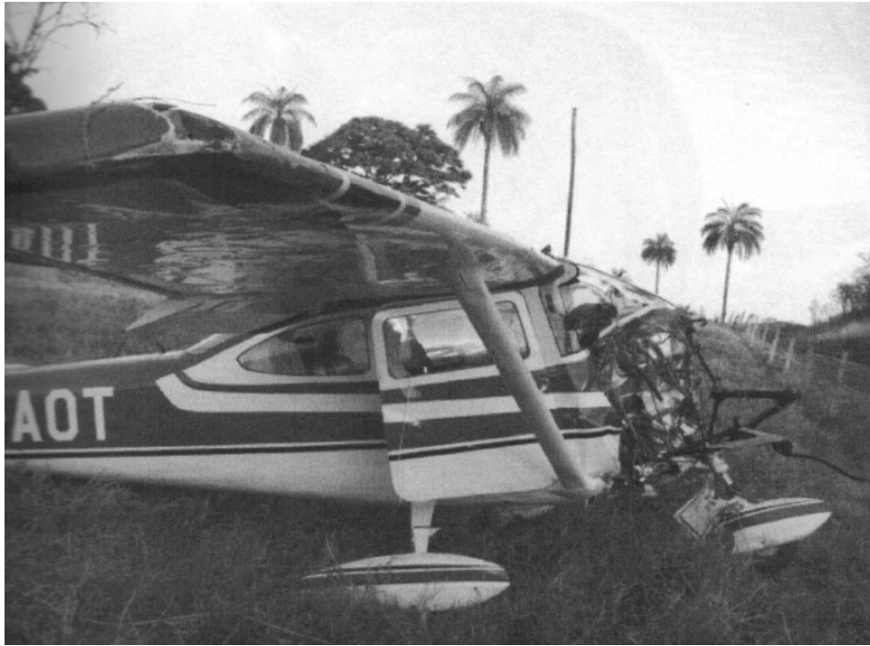
Foto 01: Vista lateral da aeronave com destaque para os danos na parte frontal e no bordo de ataque da asa.