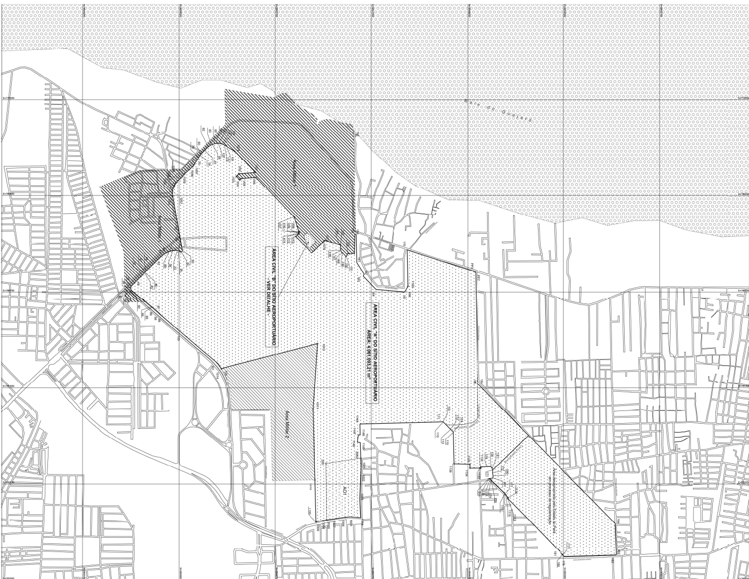
DETA Elev.: 1 / 500