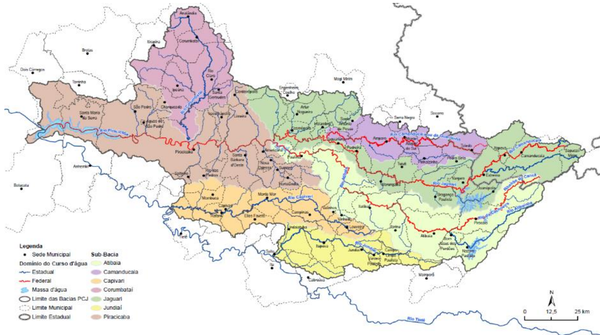
Figura 2. Bacias Hidrográficas dos rios Piracicaba, Capivari e Jundiá (Bacias PCJ)