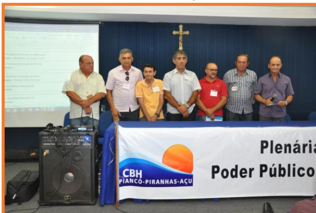
Poder Público Municipal – Sousa/PB