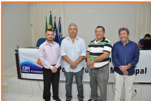
Poder Público Municipal – Currais Novos/RN