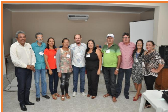
Sociedade Civil - Caicó/RN