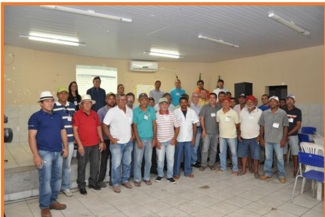
Usuário de Água - Alto do Rodrigues/RN