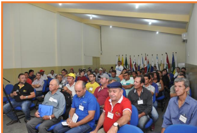
Sociedade Civil - Itaporanga/PB