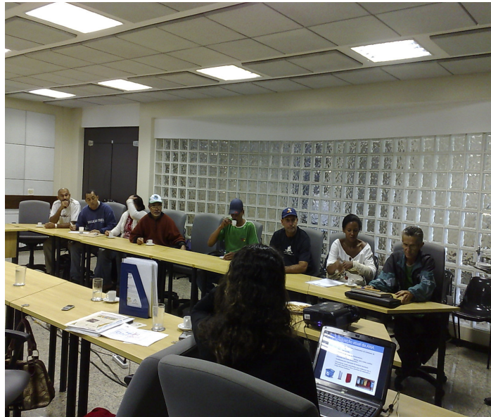
Figura 1: Foto do processo de seleção das cooperativas em 25 de fevereiro de 2011

A partir do último certame, a coleta seletiva na ANA passou a ser realizada por um período de doze meses, em vez de seis, como versa o artigo 4º do Decreto nº. 5.940/2006. Essa prática já é comum em outros órgãos da Administração Pública que atendem ao Decreto, como INFRAERO, IBAMA, Ministério da Fazenda e Ministério da Educação. A operacionalização em um período de seis meses é muito burocrática e até dispendiosa para ambas as partes, daí o motivo da adaptação. O único cuidado tomado foi que houvesse consenso entre as cooperativas, o que ocorreu no dia 25.02.2011.