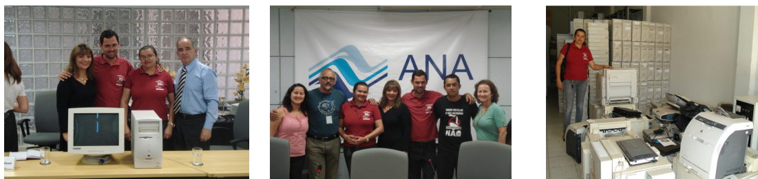
Figura 2: Doação de equipamentos eletrônicos à cooperativa Recicle a Vida

código de barras, retroprojetores, scanners, estabilizadores, nobreaks, hubs e gravadores de CD/DVD) em perfeito estado, mas considerados antieconômicos à atividade administrativa de um órgão público. Essa cooperativa centralizou o recebimento das doações e ficou incumbida de distribuir os equipamentos entre as demais cooperativas afiliadas à CENTCOOP.