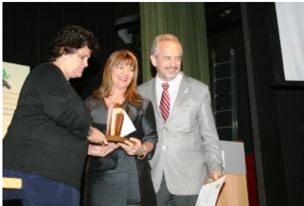
Figura 4: Ministra do Meio Ambiente (à esq.) entrega troféu para representantes da ANA

Com base nessas ações da Comissão da Coleta Seletiva Solidária, a ANA recebeu, em 2011, um troféu de 3º lugar no 3º Prêmio Melhores Práticas da A3P, com o projeto “Implementação da Coleta Seletiva Solidária e Promoção da Educação Ambiental na ANA”.