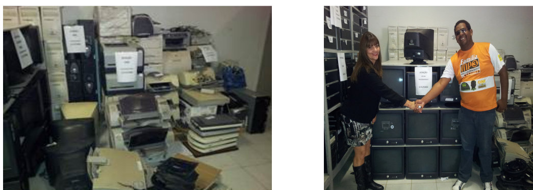
Figura 3: Doação de equipamentos eletrônicos à ONG Programando o Futuro

Mais uma vez, no final de 2012, a ANA doou itens eletrônicos inservíveis para uma instituição de condicionamento de eletrônicos, a ONG Programando o Futuro . Foram entregues mais de 350 equipamentos de informática subutilizados, entre eles computadores, monitores, impressoras, scanners e nobreaks. A Organização cria espaços de inclusão digital para capacitar jovens de comunidades carentes, que também aprendem a recondicionar, reciclar e reutilizar esses eletrônicos.