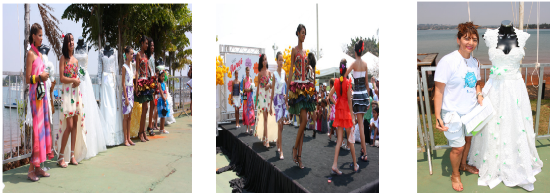
Figura 7: Apoio da ANA na Semana do Lago Limpo

Além das ações internas, a Comissão da Coleta Seletiva Solidária da ANA apoiou a Semana do Lago Limpo, evento em parceria com a Agência Reguladora de Águas, Energia e Saneamento do Distrito Federal – ADASA. Ele foi criado com o intuito de chamar a atenção dos governantes e de toda a comunidade para a importância de se preservar os recursos hídricos do Distrito Federal, com enfoque para o Lago Paranoá, principal lago de usos múltiplos da região do DF.